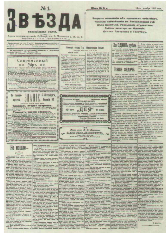
Trang đầu báo "Ngôi sao", số 1, ngày 16 tháng Chạp 1910, trong đó đăng bài của V. I. Lê-nin "Những ý kiến bất đồng trong phong trào công nhân châu Âu"

Chỉ qua một sự kiện đó cũng thấy rõ ràng, không thể giải thích những khuynh hướng thoát ly ấy bằng những sự ngẫu nhiên, bằng những sai lầm của những cá nhân hay những nhóm cá biệt, thậm chí bằng ảnh hưởng của những đặc điểm hay những truyền thống dân tộc, v. v.. Nhất định phải có những nguyên nhân căn bản nằm trong chế độ kinh tế và trong tính chất phát triển của tất cả các nước tư bản chủ nghĩa, những nguyên nhân luôn luôn đẻ ra các khuynh hướng thoát ly nói trên. Tập sách nhỏ xuất bản năm ngoái của nhà mác-xít Hà-lan An-tôn Pan-nê-cúc nhan đề là: "Những ý kiến bất đồng về sách lược trong phong trào công nhân" (Anton Pannekoek. "Die taktischen Differenzen in der