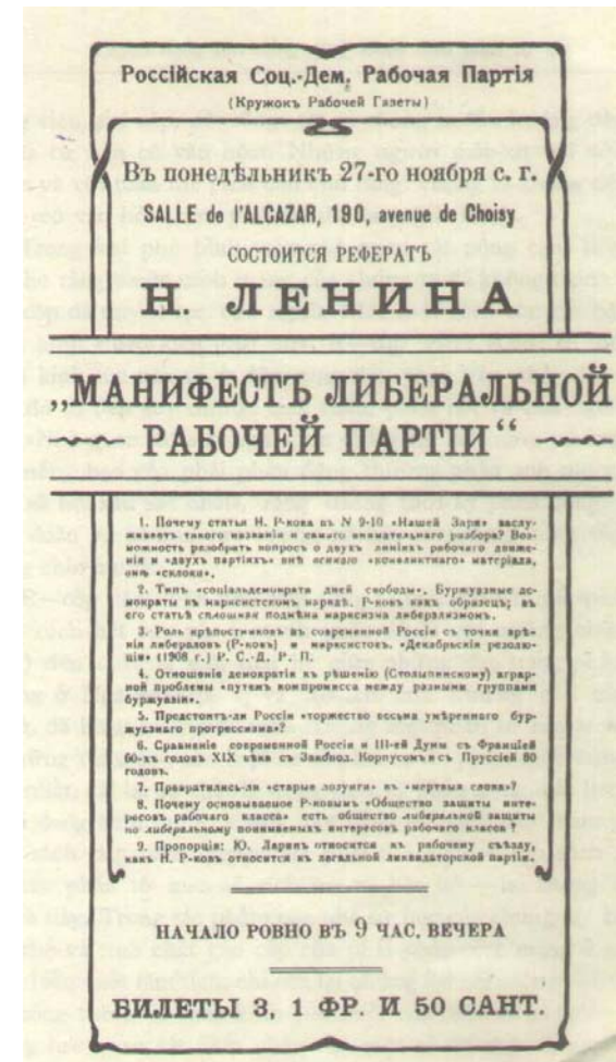
Thông cáo về buổi thuyết trình của V. I. Lê-nin về đề tài "Tuyên ngôn của đảng công nhân theo phái tự do", ngày 14 (27) tháng Mười một 1911 ở Pa-ri Ảnh thu nhỏ

Chúng ta thì cho rằng điều sau đây là hoàn toàn không thể nghi ngờ và chối cãi được: đây là cách đặt vấn đề thuần tuý tự do chủ nghĩa. Phái tự do chỉ giới hạn trong việc xét xem sẽ có "chủ nghĩa tư bản có văn hoá" hay không, sẽ có "bão táp" hay không. Người mác-xít không cho phép chỉ giới hạn trong việc đó, mà đòi hỏi phải phân tích xem trong xã hội tư sản đang tự giải phóng, những giai cấp nào hay những tầng lớp nào trong các giai cấp đang tiến hành một đường lối này hay một đường lối khác, một đường lối cụ thể xác định nhằm thực hiện việc giải phóng đó, nhằm tạo ra chẳng hạn những hình thức chính trị này hay những hình thức chính trị khác của cái gọi là "chủ nghĩa tư bản có văn hoá". Trong thời gian "bão táp" và trong thời gian rõ ràng là không có bão táp, những người mác-xít tiến hành một đường lối khác về nguyên tắc với chủ nghĩa tự do: đường lối tạo ra những hình thức sinh hoạt thật sự dân chủ, chứ không phải những hình thức sinh hoạt "có văn hoá" nói chung. Phái tự do, tỏ vẻ là một