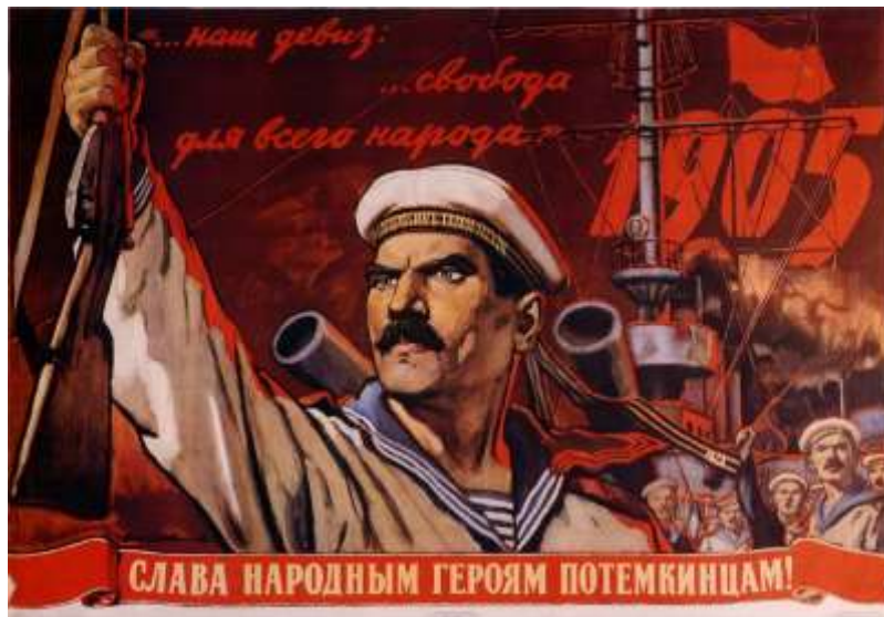
Affisch till minne av myteriet på pansarkryssaren Potemkin i juni 1905

Splittringen mellan bolsjeviker och mensjeviker betydde att det ryska socialdemokratiska arbetarpartiet stod inför den första ryska revolutionen 1905 i en försvagad och modfärdig sinnesstämning. Ingen av fraktionerna kunde lyckönska sig själv till segern i denna förödande strid.