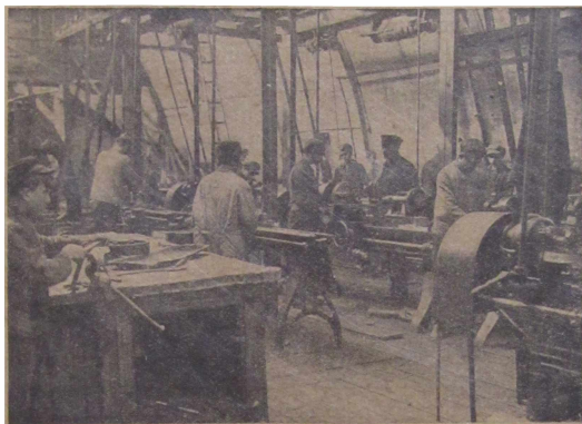
Punaisen Putilovin tehdaskoulu. (Sorvausosasto)

työväen joukon lisäksi 80-miljoonaa talonpoikaakin. Näin on punnittava nykyiset proletaariset vallankumoukselliset, ne, jotka tahtovat olla johtajina vallankumouksen perusvoimana. Jos puolueemme huolehtisi vain proletariaatista tehtaissa ja työlaitoksissa, olisi se ammattijärjestö, eikä luokkajär-