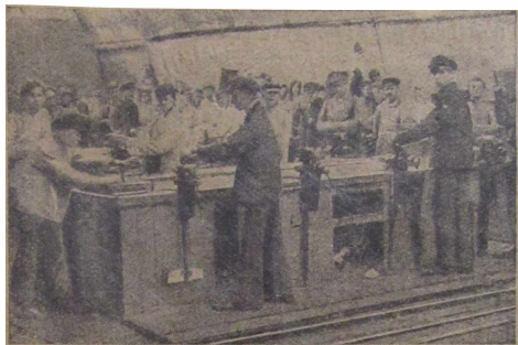
Pun. Putilovin tehdaskoulu. (Viilausosasto).

poikaisnuorisoon. Mutta tietysti lukumäärä yksin ei ratkaise kysymystä. Erikoisen tärkeätä työssämme on sen laajuus ja vauhti. Ei pety sanoessaan, että VKNL vasta alkaa tunkeutua elämän ytimeen, nuorisjoukkojen syvien rivien keskuuteen, ja sekaantua sen elämän kaikkiin kysymyksiin, mikä ajan oloon tulee muodostumaan sen työn perussisällykkeksi.