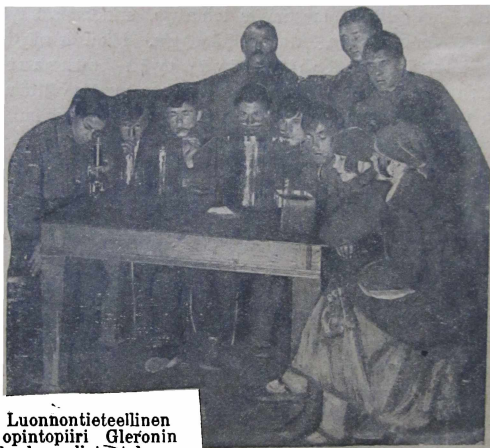
Luonnontieteellinen opintopiiri Gleronin keskusvalistustalossa

Ottakaa tehtäväksenne vaikka yhden Marxin ja Leninin kirjan perinpohjainen tutkiminen vuodessa (en sano kuukaudessa, sillä en aseta täytettäväksi mahdottomia tehtäviä).