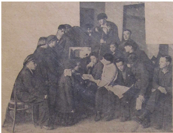
Gleron-nimisen keskusvalistustalon laulupiiri.

merkityksessä on venäläinen pappi lyönyt kaikki rekordit. Minä en vastusta pappien pilkkaamista. En ole sitä vastaan jos te papin pilkkaamista varten ette aseta ristiä varsin mukavaan paikkaan. Mutta ei ole kysymys siitä, että pilkattaisiin maailman tyhmintä pappia, joka äärettömästi rosvo ja tuho talonpoikaistoamme (se on tehtävä),