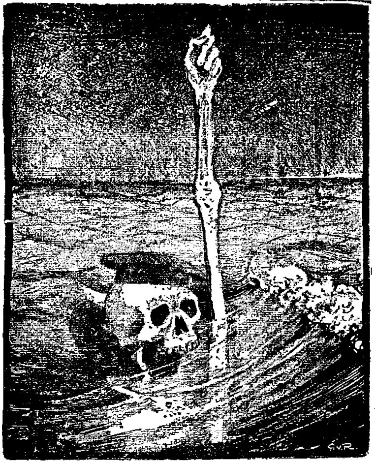
"Ei koskaan enää sotaa"

Auto pysähtyi ja matkailijat astuivat ulos. Seurasasi tavanmukainen opasnäytelmä, joka minuun on aina tehnyt ärsyttävän vastenmielisen vaikutuksen. Mutta erikoisesti tällä kiertomatalla satojentuhansien miesten haudoilla tuo ammattinsa pintapuolisuttama ja koneellistuttama sanakone suorastaan raivostutti. Päivämääriä, numeroita, kenraalien nimiä ranskan- ja englanninkielellä — ja taas päivämääriä, numeroita ja nimiä tunteettomasti, kui-