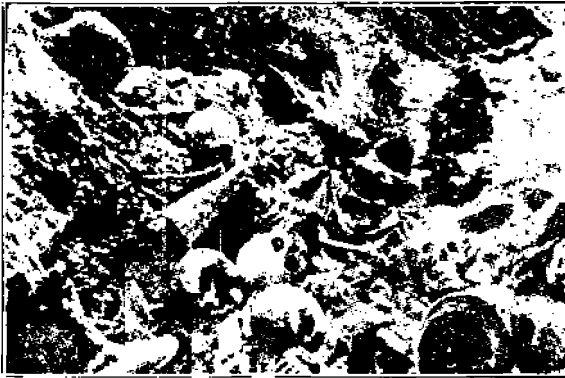
Avattu juoksuhauta Verdunin luona paljastaa ihmisen mielettömyyksistä suurimman, sodan, kamaluuden