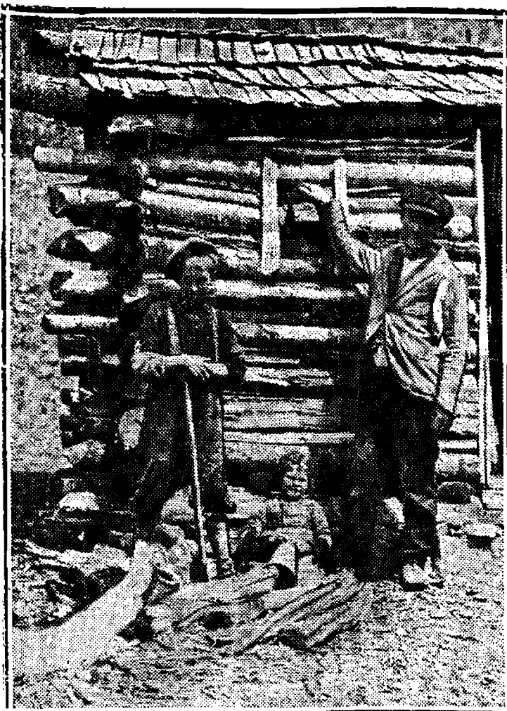
"Koti, kallis koti." Työttömän asunto lähellä presidentti Hooverin kesähuvilaa

Me olemme suurten tapahtumain kynnyksellä. Siksi ei pitäisi olla syytä pessimistisyyteen. Päinvastoin olisi syytä entistä toivorikkaammin katsoa tämän maan työläisillä tarjolla olevia suuria ja historiallisia mahdollisuuksia. Nyt jos koskaan olisi aika astua eturintamaan järjestämis-