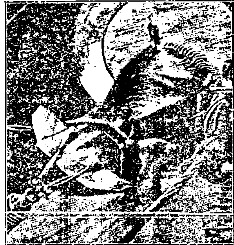
Erikoisen aukko, josta valas vedetään laivaan.

Jäävuorien alituksesti ympäröimänä oli ilmasto hyvin kylmää ja hyvin usein satoi vettä oikein rankasti. Seuduilla oli enemmän sateita kuin poutatapäiviä.