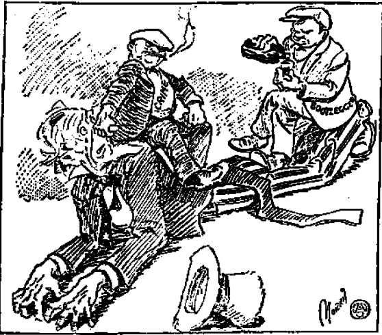
Kieltolaki "märän" silmällä katsoen

Yhteiskunta liikkuu aina kahden äärimmäisyyden välillä. Toisella puolen on ehdoton anarkia ja toisella puolen ehdoton keskittyneisyys. Ja käytännön kannalta katsoen ei kumpikaan ole virheen.