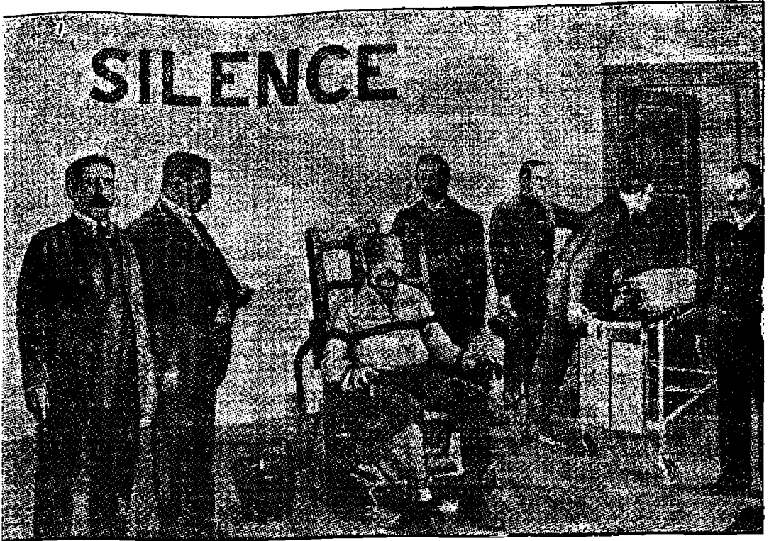
Vanzetti Sähkötuolissa; Saccon ruumis vietään leikkuuhuoneeseen

rinen' ja konservatiivinen Massachusettsi paistaa ihmisen elävänä.