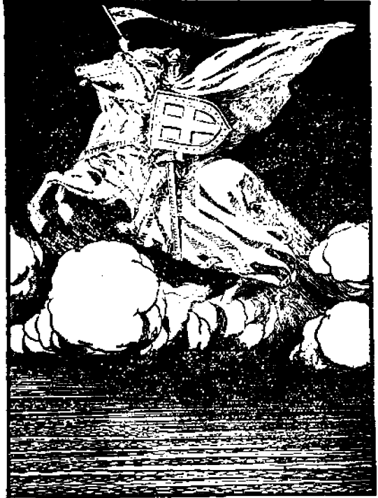
"Entisajan ristiretkelijä—"rauhan enkeli."

"Ja niin hän ( Konstantinus ) rukoili hartaasti kristittyjen Jumalaa, että hän ( Jumala ) ilmestyisi hänelle ( Konstantinukselle ) ja osoittaisi kuka hän on, ja ojentaisi oikean kätensä ja auttaisi häntä hänen vaikeuksissaan. Ja katso, juuri kun hän suurella hartaudella rukoili, ilmestyi taivaalle mitä ihmeellisin merkki, jota olisi ollut vaikea uskoa, jos sen olisi joku muu henkilö kertonut. Mutta koska voittoa keisari sen itse kertoi pitkän ajan kuluttua tämän historian kirjoittajalle, kun tämän kirjoittajalla oli kunnia olla hänen ( Konstantinuksen ) seurassa ja tuttavuudessa, ja vahvasti kertomuksensa valallaan, niin kuka voisi epäillä tapauksen todenperäisyyttä, varsinkin kun sitä seurannut aika (nähtävästi tällä tarkoitetaan Konstantinuksen