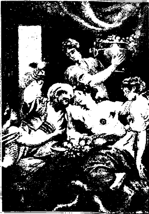
Niin ennen—niin nyt.

Rooman valtakunta muodostui silloin, ja aina kukistumiseensa saakka, irstaasta ja raakamaisesta ylimysluokasta, ja tietämättömästä ja orjamaisesta alhaisosta. Jatkuva sodankäynti rappeutti kansan. Ylimyksien juhlatilaisuuksissa harjoitettuja moraalittomuuksia ja luonnottomia intohimojen tyydytyksiä pidetään sopimattomina painaa. Hallitsevan luokan jäsenet eivät antaneet vaivata itseään uskonnollisilla seikoilla. Kreikan ja Rooman, Egyptin ja Palestiinan jumalat olivat Rooman patriiseille samanarvoiset. Ne olivat kaikki taruoppillisia olemuksia.