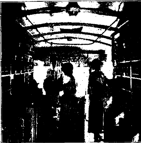
Nykyaikainen kauppa pyöräin päällä.

Me voimme nähdä selvästi tänäpäivänä, mitä tämän suuntaisen kehitys on saanut aikaan tuotannon alalla. Me tiedämme, että monien välttämättömien tarpeiden, suoraan sanoen kaikkien, tuottaminen tänäpäivänä tulee paljon halvemmaksi kuin esim. noin parikymmentä vuotta sitten. Kuitenkin kaikkien tavarain hinnat yleensä ovat paljon kalliimmat kuin ne olivat parikymmentä vuotta takaperin. Meistä monet ehkä muistavat, että parikymmentä vuotta takaperin saimme parin kenkiä kahdella ja kolmella dollarilla. Nyt saamme samanlaisista kengistä maksaa $9 — $10 parilta. Mistä tämä johtuu? Vain yksinkertaisesti siitä, että tuotannon harjoittajat, kapitalistit, ovat järjestyneet, joten he nyt ovat tilaisuudessa kiskomaan moninkerroin suurempia voittoja kuin olivat pienet keskenään kilpailevat kapitalistit tilaisuudessa tekemään parikymmentä vuotta takaperin.