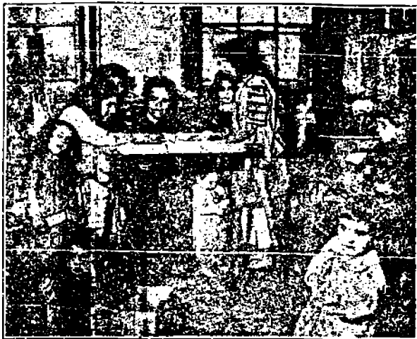
Siirtolaisten New Yorkissa täytyy tehdä työtä, aina lehdosta hauraan saakka ja kuitenkin heillä ei saisi olla oikeutta mitään vantiä.

kaikista maista tänne kerääntyneet kykenevimmat hyödylliset tuottajat, ovat tehneet Amerikan siksi mitä se tänä päivänä on. Toisin sanoen he ovat kohottaneet sen mailman mahtavimmaksi ja kehittyneimmäksi teollisuusmaaksi ja kuitenkin sanotaan, ettei näillä ulkomaalaisilla "tompeleilla", "vihreäsarvilla", pyöreäpäillä j. n. e. ole mitään oikeutta tässä maassa ruveta vaatimaan parempia olosuhteita itselleen.