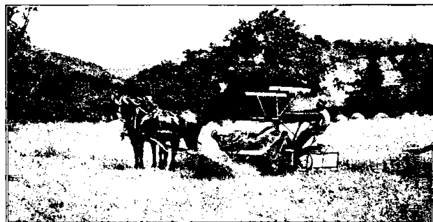
Ylijän leikkauksen kehitys kolmen vuosisadan aikana.