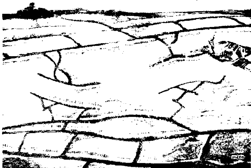
Juoksuhauta-alue, jossa vastakkaiset joukot ovat aivan lähelläkin. Valkonen ympyrä osoittaa alua, joka tuhoutuu miinan räjähdyessä juoksuhaudan alla.