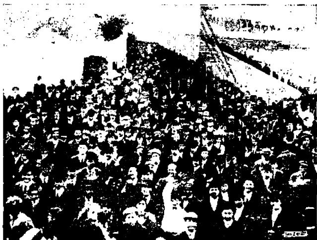
Sankat purvet rientävät "nauttimaan".

Näitä summia katsellessaan voi helposti joutua ajattelemaan, että pallopetiklupeja hallitsevat rahakkaat tekevät melkoisia vuosituloja yrityksillään. Saattaa se niin olla. Sillä eihän pallopetikenttiin sijoitettu pääoma sentään satoihin miljooniin nouse, vaikka myönnettävä onkin, että nuo suuret kentät 30,000 ja 20,000 istumatilaa sisältävine aitiointeina maksavat jotakin. Mutta näitä suuria kenttiä ei ole kaikilla klubeilla ja sitäpaitsi tie-