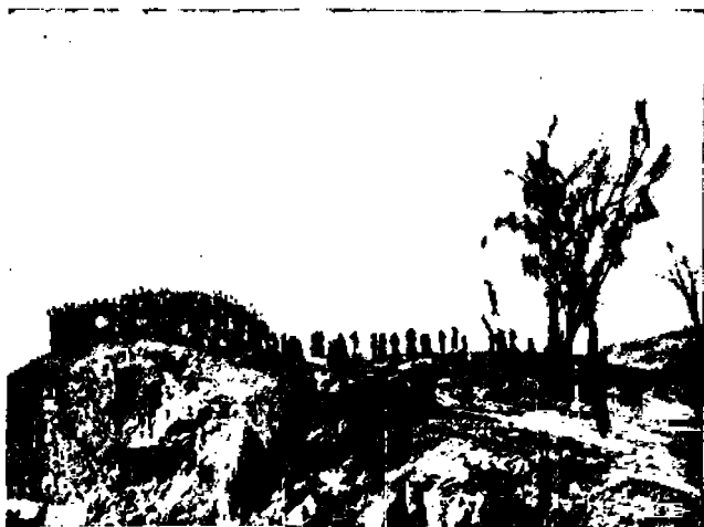
Puutkin ovat utellaan yleisön valtaamina...

Mutta paitsi tätä on klubeilla vielä muita menoja. Pelaajien "etsimiseen" on uhrattava melkoisia summia vuosittain. Jokaisella klubilla on tätä tarkotusta varten oma urkkijansa, joka käy ja katselee tuntemattomien paikallisten "tiimien" yrityksiä ja nähdessään heidän joukossaan jonkun "lupaavan" alun, pitää huolen siitä, että hän saa kunnollista "treenausta" ja kehittyä huomattavaksi pelaajaksi, tietysti urkkijan edustamassa klubissa. Näiden herrojen palkat kuu-