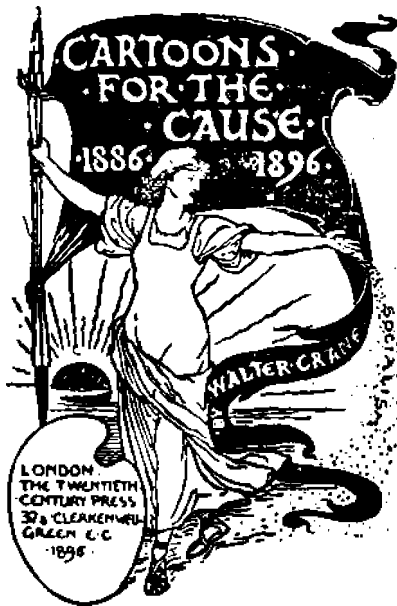
W. Cranen julkaiseman taiteellisten kuvien albumin kansilehti.

lin” ja syvällisesti oli sen tutkinut, silloin alkoi hänelle selvitä yhteiskunnalliset kysymykset niiden todellisessa valossa. Tästä lähtien omaksui hän työnsä sosialismin hyväksi.