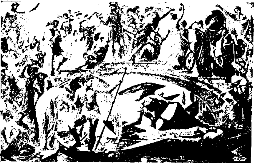
W. Crane: "Elämän siltä".