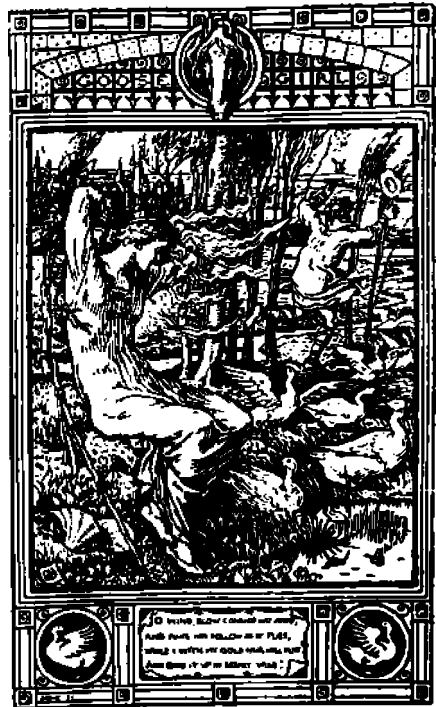
W. Crane; "Palmentyttö".

lut mahdollista. Nykyisessä yhteiskunnassa vallassaoleva voittojärjestelmä vaikuttaa kaikkea hyvää, niin taiteessa kuin muuallakin, ja kaikkea kauneutta vastaan. Rikkkauksien oikea jako vasta kykenee luomaan elämään suurempaa yksinkertaisuutta ja arvoa sekä on samassa määrässä vaikuttava taiteeseen ja arkitehtuuriin. Koko innoillaan uhrasi Crane voimansa nykyisen yhteiskuntamuodon muuttamiseksi. Sentähden liittyi hän niihin työläisiin, jotka taistelivat uuden yhteiskunnan puolesta, sillä hän tiesi, että ainoastaan työväenluokka kykeni luomaan uuden maailman. Taiteen olemus oli hänen mielestään harmoniaa ja yhtenäisyyttä. Ennenkuin saattoi päästä harmooniseen taiteeseen ja yhtenäiseen ajattusmaailmaan, täytyi elä-