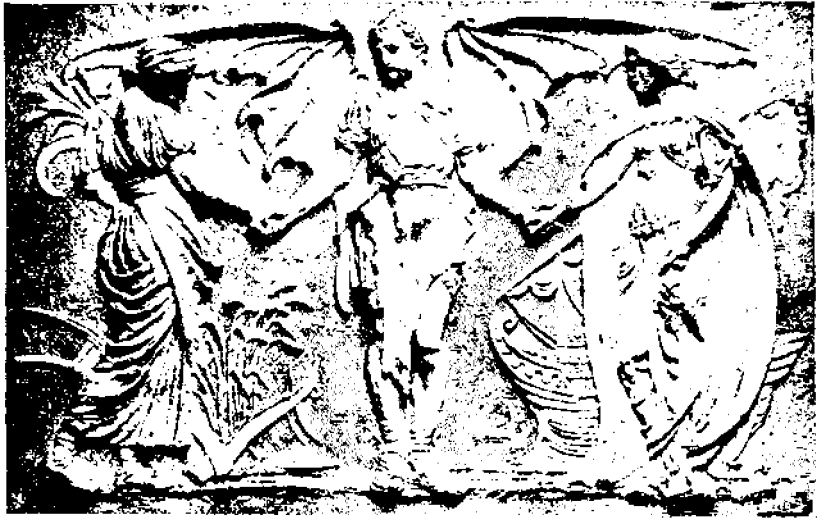
W. Crane: "Teollisuus yhdisti kaupan ja maanviljelyksen".