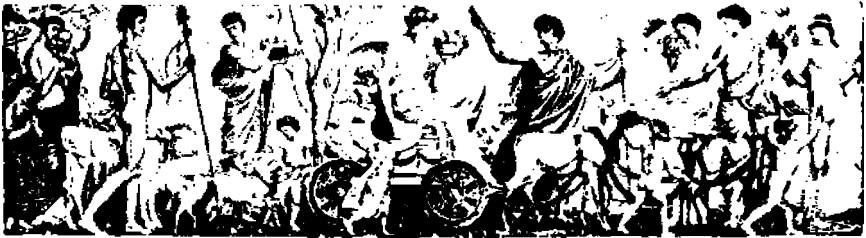
W. Crane; "Kevään voitto".