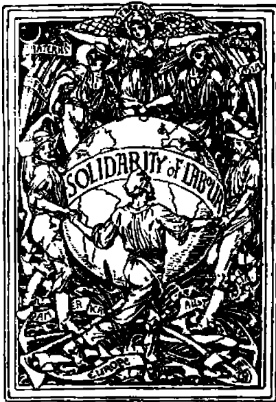
W. Crane; "Työn yhteishenki".

mässä toteuttaa harmonia ja yhtenäisyys. Jotta tällöinen tila aikaansaataisiin ja hänen rakastamansa taide pääsisi nousemaan korkeimmille tasoille, sentakia tuli Cranesta sosialisti, sentakia asetti hän koko suuren taitonsa meidän asiamme hyväksi, sentakia otti hän vastaan luokkaveljiensä ylenkatseen ja ryhtyi tuimaan taisteluun työläisten kanssa, heidän vapauttamisekseen.