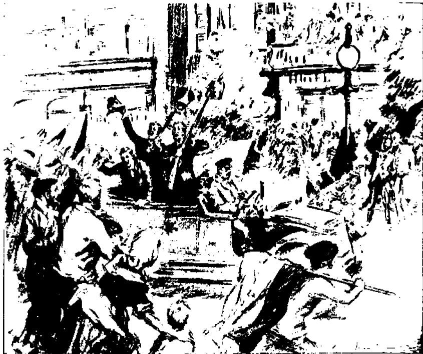
“Isänmaallista” innoitusta Berliinissä

Työttömyys ja ruoka- sekä mui- ten kulutustarpeitten korotetut hinnat ovat jo hyökyaaltona saapu- neet yli merien ja verivihollisen ta- voin takovat työläisiä, joka puo- lelle, joka ainoa tunti, lisäten hyök-