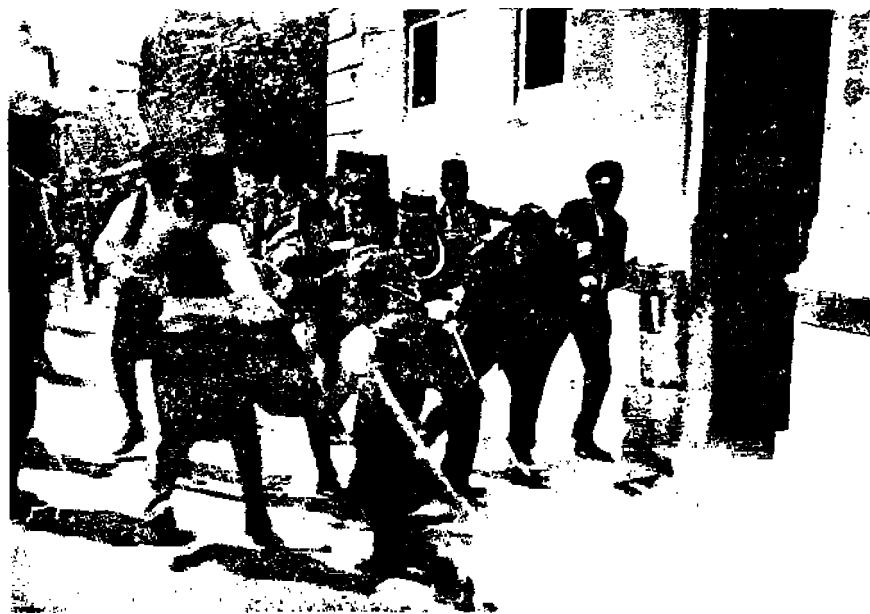
Hävällän kruununprinssin marluaja vangitaan Serajevossa

Ne vaatimukset, joita Amerikan työväenluokalta mahdollisesti tullaan vaatimaan täytettäväksi, tule-