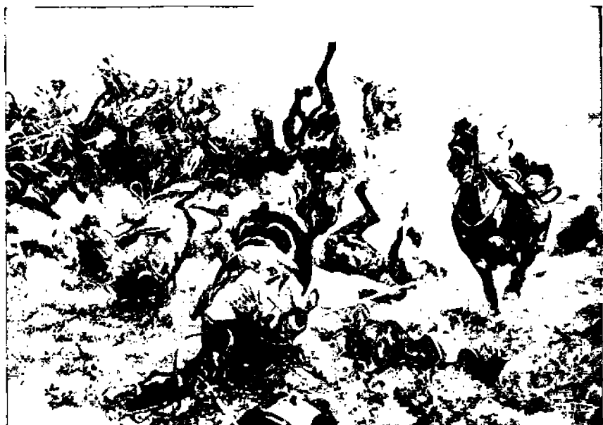
Sotaa, niinkuin se on.

Jos Amerikan työläisillä on joi-takin päivänvaatimuksia, jotka