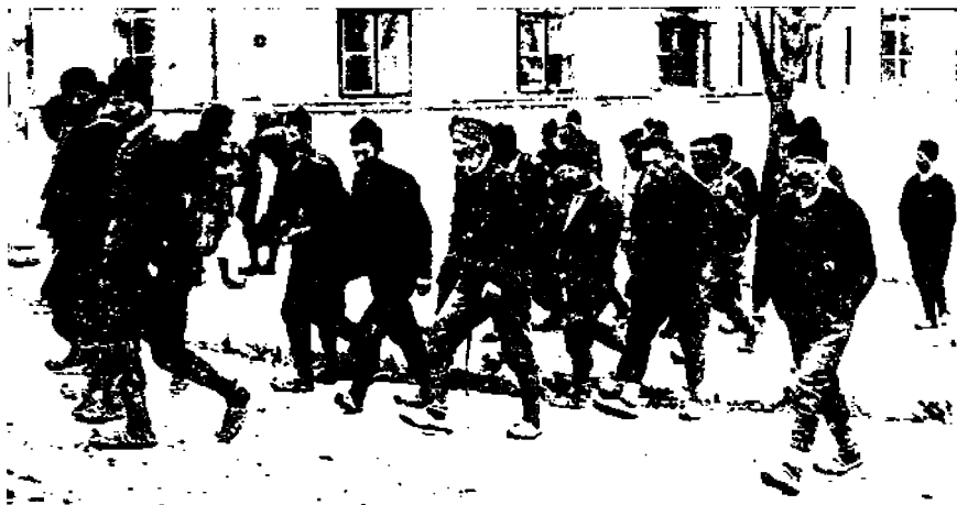
Serbialaisia rekryyttejä matkalla kutsuntapaikoille.

Niille, jotka seuraavat teollisuusmailman päiväntapahtumia, ei ole