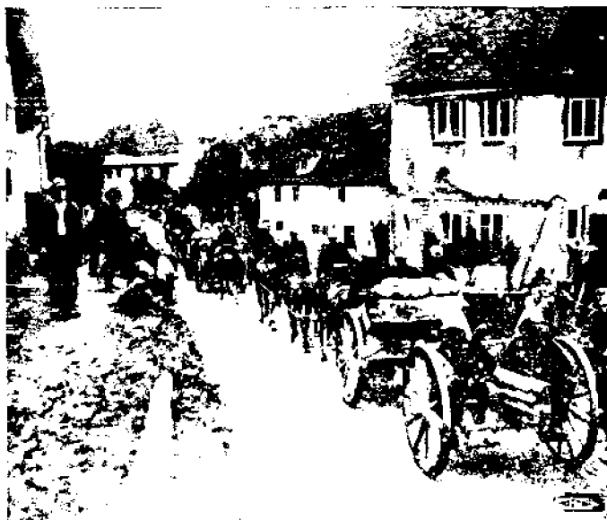
Saksan sotajoukot Belgiassa.