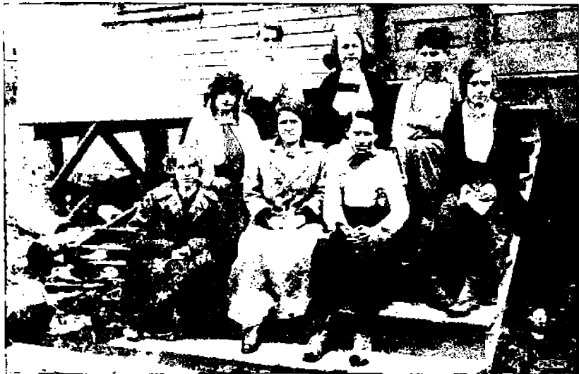
Quincyn koulun taistelulukaarti.

Nuori opettaja omintakeisesti tarttui työhönsä. Hän ei halunnut syöttää oppilailleen kuluneita valheita historian "suurmiehistä" ja kaavamaisia sovinnaisen elämän nukuttavia juttuja. Hän halusi opettaa lapsille elämää, osoittaa mikä vääryys maailmassa vallitsee, missä on tie suurempaan onneen ja