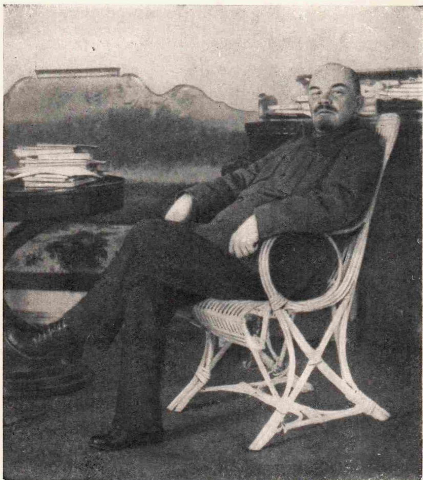
V. I. Lenin Gorkissa. Valokuva, 1922.