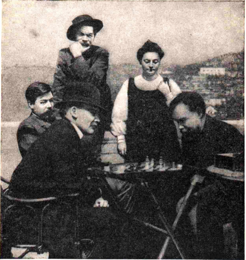
V. I. Lenin M. Gorkin luona Kaprin saarella. Valokuva, 1908.