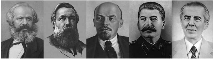
Karl Marx, Friedrich Engels, Vladimir Lenin, Joseph Stalin, Enver Hoxha 5 C l a s s i c s o f M a r x i s m

Comintern (Stalinist-Hoxhaists) http://ciml.250x.com