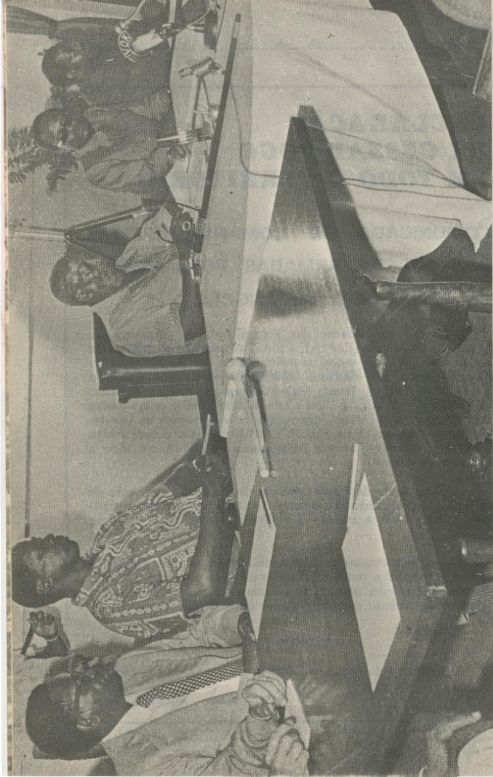
ACORDO DE MOMBAÇA