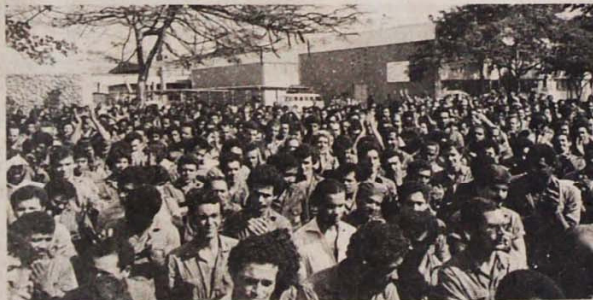
Greve na Emaq em julho: a mobilização na campanha salarial ajudou a Chapa 1

A votação nas grandes fábricas foi bem dividida: na General Elétrica e no Estaleiro Caneco a Chapa 1 foi vencedora; já no Estaleiro Ishibrás e na Emaq quem teve mais votos foi a Chapa 2. Em termos geográficos, a Chapa 1 levou a melhor em