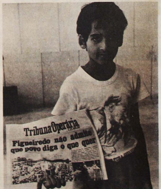
Pequeno vendedor da Tribuna: com oito anos de idade, já é um veterano