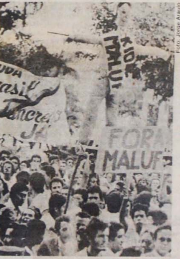
No Sergipe, Bahia e Ceará as manifestações de protesto acompanham as viagens do candidato dos militares, Maluf.

Mo pagamento para os convencionais que malufassem. Se a falta de apoio dos políticos pode ser avaliada pela quase totalidade dos governadores nordestinos - todos do PDS - que não malufaram, mais evidente ainda é a ojeriza que a simples menção do nome Maluf causa ao povo daquela região.