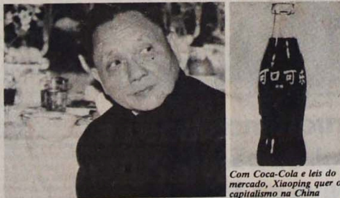
Com Coca-Cola e leis do mercado, Xiaoping quer o capitalismo na China

O plano dos dirigentes de Pequim é transformar a China numa superpotência imperialista. Mas, para isto, eles precisam desenvolver mais a indústria local, produzir mais riquezas para poder exportar seus capitais e explorar outros povos. O caminho que escolheram foi reforçar o capitalismo interno, garantir os lucros dos exploradores nacionais, e atrair o capital imperialista para setores da economia em que os chineses ainda carecem de tecnologia avançada e experiência administrativa. Dal o Diário do Povo, na