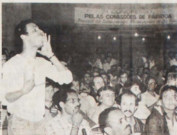
Os metalúrgicos de São Paulo aprovaram em assembleia a luta pela comissão de fábrica

Para conquistar o reconhecimento de suas comissões, os operários enfrentam violenta resistência do patronato. Este não tolera uma organização sindical no local onde se dá a extração da mais-valia; teme que este organismo sirva para unificar os operários da empresa e posteriormente toda classe; alguns empresários chegam a afirmar que tais comissões podem se tornar no futuro embriões do poder socialista!