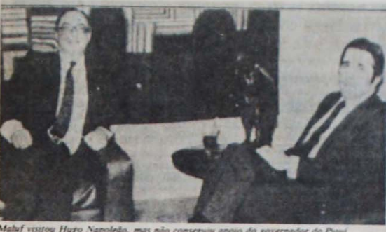
Maluf vestiu Hugo Napoleão, mas não conseguiu apoio do governador do Piauí.

Na semana passada, os governadores do PDS da Bahia, do Rio Grande do Norte e do Piauí anunciaram seu apoio ao candidato das oposições, Tancredo Neves.