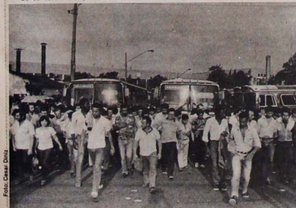
A pregação mlope das lideranças petistas não tem respaldo entre os operários em S. Bernardo