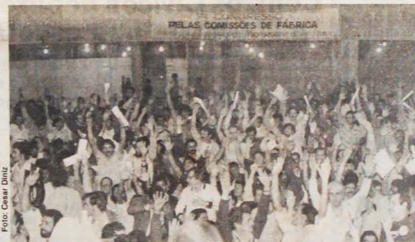
Uma bandeira que se tornou obrigatória e prioritária para os sindicatos atuantes