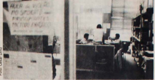
Agentes do Ministério do Trabalho vasculham a entidade.

Cerca de 10 mil canavieiros realizaram passeata pelo centro de Recife na terça-feira, dia 16, para protestar contra a ação dos usineiros, que recorreram ao Tribunal Superior do Trabalho para anular as conquistas da última greve. Os 240 mil trabalhadores na cana afirmam em documento que se as conquistas do DRT forem anuladas eles voltarão a paralisar as usinas. Na passeata ficou evidente a disposição dos cortadores de cana em resistir às frotas dos patrões. (das sucursais)