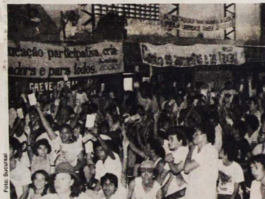
Os estudantes condenaram Maluf e rejeitaram as propostas sectárias do PT

Por outro lado, as inúmeras investidas dos grandes proprietários na tentativa de desalojar os minifúndios aceleram esta insustentável situação, juntando-se ainda aos seguidos despejos de posseiros sem título da propriedade, o que é muito comum nesta região. Correndo no mesmo nível, constata-se o mais recente processo de elevação do número dos despossuídos do campo: os que trabalham nas culturas de subsistência estão sendo trocados pelas máquinas dos grandes proprietários, que optam pela monocultura. Este processo se verifica com os fazendeiros que possuem terra na região e moram em outros Estados. (Mário Luiz Milani de Cascavel)