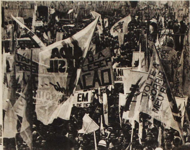
O maior comício já realizado no Pará marcou o entusiasmo oposicionista do povo.