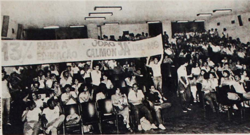
O Congresso da UEE de Minas mobilizou 370 delegados em favor da candidatura única

A nova diretoria da UEE de Minas Gerais está agora empenhada em levar um grande número de delegados ao 36º Congresso da UNE, no Rio de Janeiro, entre os dias 25 e 28 deste mês.