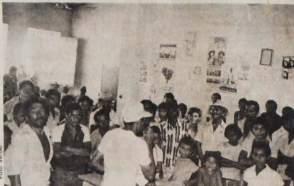
Canavieiros realizam assembleia no STR de Alagoa Grande e decidem manter a paralisação

A Federação dos Trabalhadores na Agricultura (Fetag) prevê que mais de 100 mil canavieiros estão parados. "Nós estamos em greve e só voltamos ao trabalho com nossas reivindicações atendidas", afirmou Alvaro Diniz, presidente da Fetag, à Tribuna Operária. Além dos canavieiros, também paralisaram suas atividades os trabalhadores do