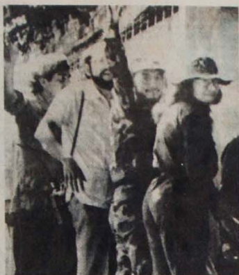
Líderes da guerrilha chegam a La Palma

Várias forças políticas internacionais saudaram o encontro de 15 de outubro, como "o passo decisivo para a pacificação de El Salvador e de toda a América Central". É uma afirmação intempestiva, evitada de engodo e mistificação. As forças verdadeiramente antiimperialistas e o próprio povo de El Salvador têm aprendido do duro con-