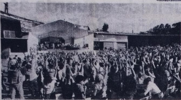
Assembleia dos mutuários gaúchos, em Porto Alegre, dia 19

Quando à chapa 2, que também se diz de oposição, Galo esclarece: “Não adianta vir se dizer oposição nas vésperas das eleições, pois eles sempre estiveram junto com o Othelo, não fizeram nada, não tem crédito”. Já os membros da chapa 3 sempre estiveram à frente das lutas da categoria, pressionando os patrões e organizando os rodoviários. (da sucursal)