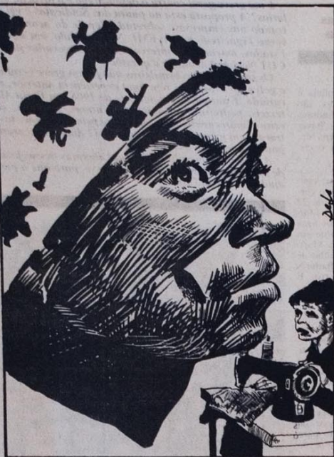
heres e a nosso povo em paz. (Comissão Pró-Movimento Popular da Mulher - Belo Horizonte, Minas Gerais)

Os senhores do FMI e seus seguidores que deixem a nós mu-