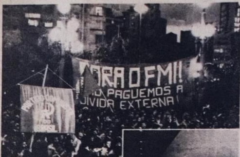
Wiesner e Struckmeyer, que passaram as ordens do FMI ao governo brasileiro, e a opinião do povo que se levanta.

Olavo Setúbal, o banqueiro do Itaú, reclama: "Estamos imobilizados por questões de curto prazo, sem qualquer elemento capaz de fornecer parâmetros mínimos de certeza e segurança para a programação empresarial". Figueiredo responde pela televisão que não vai tomar "medidas apressadas" porque "o barco deve seguir um rumo cuidadoso". Ou seja, só tomará medidas depois de acertar tudo com o FMI, nas negociações onde, segundo um assessor de Delfim, "está sendo decidida a vida do país".