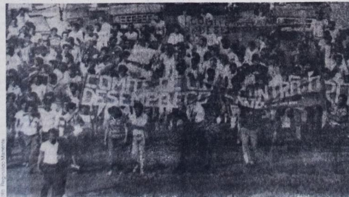
Na segunda-feira os desempregados fizeram comícios em várias fabricas falando da greve geral.