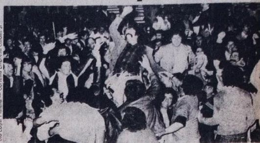
“Galo” foi carregado pelos rodoviários no final da vitoriosa greve de 1979

Contando com a ajuda da atual direção do Sindicato, os patrões usam e abusam. No dissídio de 1981 o piso da categoria passou para Cr$ 101 mil, mas esta conquista é sabotada pelos empresários como denun-