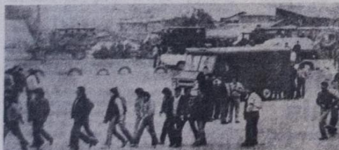
A resposta de Pinochet as manifestações populares e o aumento da repressão

O ambiente é de extrema tensão e expectativa. Nem o anúncio apressado da anistia, concedida a 128 exilados políticos, conseguiu dissipar a perspectiva de confronto. Se a greve for vitoriosa, representará um poderoso golpe no regime militar do general Augusto Pinochet.