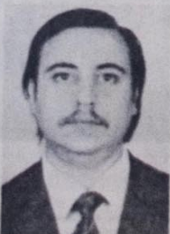
Deputado João Gilberto Lucas Coelho apoia TO

O deputado João Gilberto Lucas Coelho (PMDB-RS) afirma que "no momento em que integrantes do jornal Tribuna Operária são ameaçados com a maldada Lei de Segurança Nacional, instrumento do autoritarismo para impedir a democratização real do debate político no país, recebam a nossa solidariedade em defesa do direito de expressarem suas ideias e suas posições políticas. Igualmente, o apoio pela contragente, o jornal vem enfrentando os temas da atual conjuntura nacional". Ainda no Rio Grande do