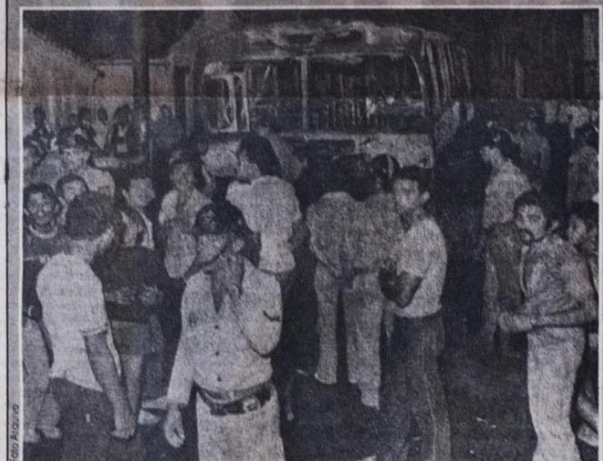
Após a quebra-quebra de 1981, até ônibus gratuito os baianos conquistaram...

do falso moralismo reverencioso no homem do povo. Ideologia opressora que há muito mantém as oligarquias na direção política-social-econômica do Estado. Época em que se chamava um negro - que representa a maioria da população oprimida - de mulato, escurelho e escambau... e esse se dava por contente. O mulato ficava pé da vida se fosse chamado de crioulo, por um desavisado. O otário-malandro se considerava branco e afirmava presunçosamente que não tinha nenhum compromisso com os descendentes do Continente Africano. Era a época