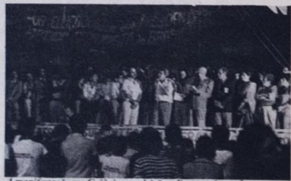
A manifestação em Goiânia por eleições diretas: não coube

A participação no simpósio, acanhada, restrita, espelhou em parte essas indefinições. Ficou a impressão de que, na hora de convocar a opinião pública a debater junto com o PMDB temas tão explosivos como desemprego, salários e eleições diretas para a Presidência, terminou prevalecendo um certo medo do que resultaria de uma grande presença popular.