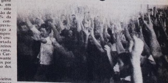
No decorrer da assembleia os canavieiros decidiram engrassar a greve ao fato de não poder demitir os grevistas

No dia 19 cerca de 500 canavieiros em assembleia decidiram continuar o movimento diante da intransigência da Pite, que ameaçou reprimir o movimento e contratar trabalhadores de outros municípios para substituir os que estavam em greve. A adesão ao movimento cresceu e a usina recuou. Recusou-se no entanto a assinar o acordo devido aos preços e