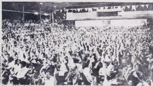
Assembléia dos bancários em São Paulo: se preciso eles param o Banco do Brasil