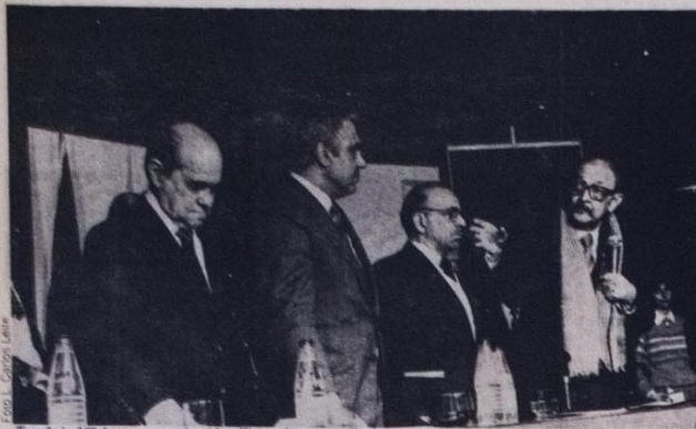
Teotônio Vilela, na mesa dos 12 milhões de votos: "Senhores governadores, me perdoem..."