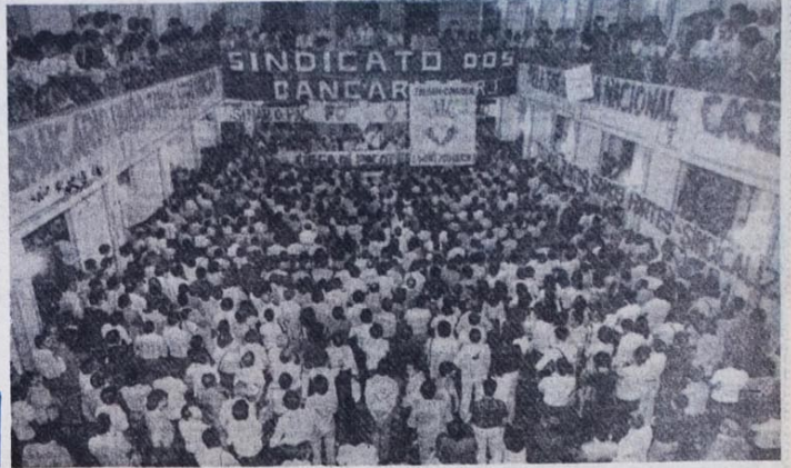
No Rio de Janeiro, 4 mil na assembleia dos funcionários do Banco do Brasil

"Fora o pacote ou greve!", conclamam os trabalhadores