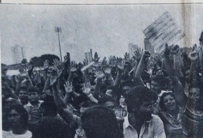
Votação: um bom exemplo da unidade com que a categoria iniciou a paralisação