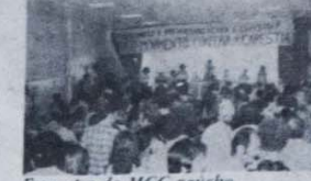
Encontro do MCC saúcho

Neste quadro, o governo reformista recorre ao mesmo remédio de seus antecessores. A repressão ao povo continua e até aumentou, da parte da Guardia Nacional e também de grupos paramilitares de extrema direita. E um caminho que divide as classes dominantes (mais três ministros renunciaram e delataram o país na semana passada), mas não há outra escolha para o donos do poder. O assassinato do arcebispo e o ataque armado ao seu enterro fazem parte dessa espiral da violência. Segundo se comenta em San Salvador, trata-se de