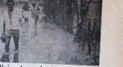
Polícia depreda Magnabosco

Ao se darem conta da demolição, os moradores se reuniram para impedir mais um ato de arbitrariedade e violência. O fim da intervenção. Como se estivessem numa guerra contra o povo, o comandante dos policiais, seus comandados e os fiscais se organizaram multilateralmente para um enfrentamento. Fizaram do bairro uma praça de guerra, partindo da praça da multidão com cassetetes. Acabaram destruindo um barracão e roubando parte da madeira utilizada na construção. O presidente da Associação dos Mo-