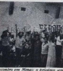
Encontro em Minas: o próximo será em Recife

Porto Alegre, RS — Cerca de 14 mil membros do Sindicato dos Bancários de Porto Alegre já assinaram um documento exigindo a imediata entrega de seu sindicato, sob intervenção desde 6 de setembro de 1979. O abaixo-assinado, dirigido ao Ministro do Trabalho da ditadura, Murilo Macedo, a firma que a intervenção caracteriza-se como um ato de violência "ao nosso direito de nos organizarmos livre e democraticamente".