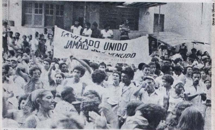
Monadores dos loteamentos clandestinos de Cuiabá não creem mais em promessas

Em todos os locais onde haja Comitês Brasileiros pela Anistia e familiares de mortos e desaparecidos na guerrilha serão realizados atos públicos, missas e manifestações, em repúdio à brutal investida das Forças Armadas da ditadura no sul do Pará.