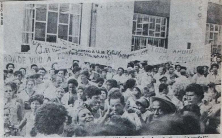
"Uma enorme multidão em passeata, gritando: 'Você é explodido, não fique aí parado!'"