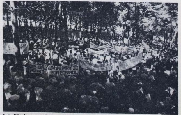
Ijuí, RS: dessa manifestação partiu a rebelião que derrubou o confisco da soja.

Mas a contrapartida deste apoio é a responsabilidade que recai sobre os metalúrgicos em greve, em primeiro lugar os do ABC, que estão na vanguarda da luta. Os trabalhadores de todo o país esperam muito deles. Esperam a vitória, que repercutiria imensamente no conjunto do movimento operário e popular. E uma greve vitoriosa não depende apenas da paralisação das máquinas. Este é o primeiro passo, indispensável, mas não é o decisivo. O que garante a vitória é a mobilização e a organização da categoria, é o emprego de todas as energias dos trabalhadores, que normalmente servem para enriquecer o patrão, em proveito da causa dos explorados.