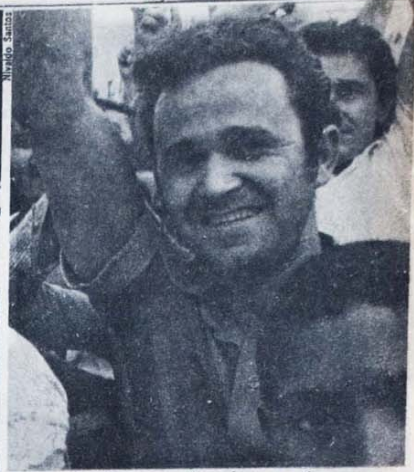
A alegria de quem descobre sua força