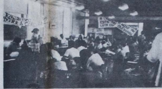
Beth entusiasmou a plateia falando da greve dos metalúrgicos cearenses

A violência contra-revolucionária não vem de hoje em El Salvador. Até ao passado, uma ditadura clássica dominava o país a ferro e fogo. No final do ano, um golpe substituiu o antigo regime por um governo militar-civil, dotado de um programa reformista. Os Estados Unidos, que sempre mandaram em El