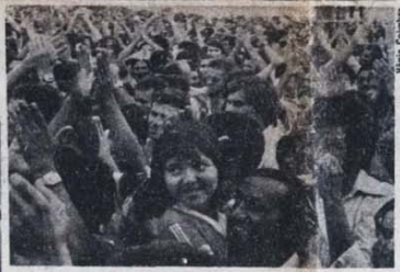
Nas fotos, o clima de entusiasmo, alegria e emoção da imensa multidão de metalúrgicos de São Bernardo, quando tomaram a corajosa decisão de decretar a sua maior greve.

400 mil metalúrgicos do ABC e interior paulista pararam. Não houve ameaça do governo, chantagem de patrão, nem manobra de pelego ou, ainda, vacilação de lideranças que pudessem quebrar a enorme disposição de luta dos operários. A greve maciça se espalhou, como um rastilho de pólvora, pelo Estado. recebeu solidariedade sem precedentes: no primeiro dia, 150 entidades populares e democráticas se reuniram na capital para dar ajuda. Entretanto, as debilidades de organização continuam a persistir