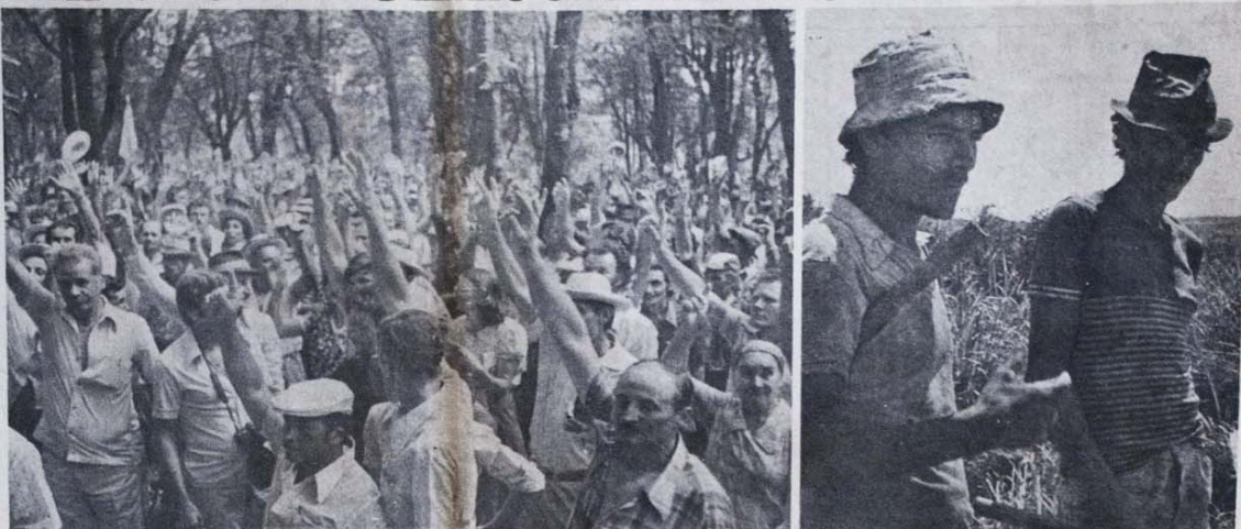
A rebelião da soja colocou em movimento centenas de milhares de lavradores indignados

"Todos sabem da terrível luta que os camponeses do sul do Pará enfrentam contra a grilagem na disputa de cada palmo de terra. E muito especialmente os lavradores de Conceição do Araguaia. Aqui, temos mais de 80 grandes conflitos de terra conhecidos, afóra outros tantos desconhecidos". Este texto é da oposição sindical de Conceição do Araguaia, que está decidida a vencer as eleições marcadas para 29 de junho.