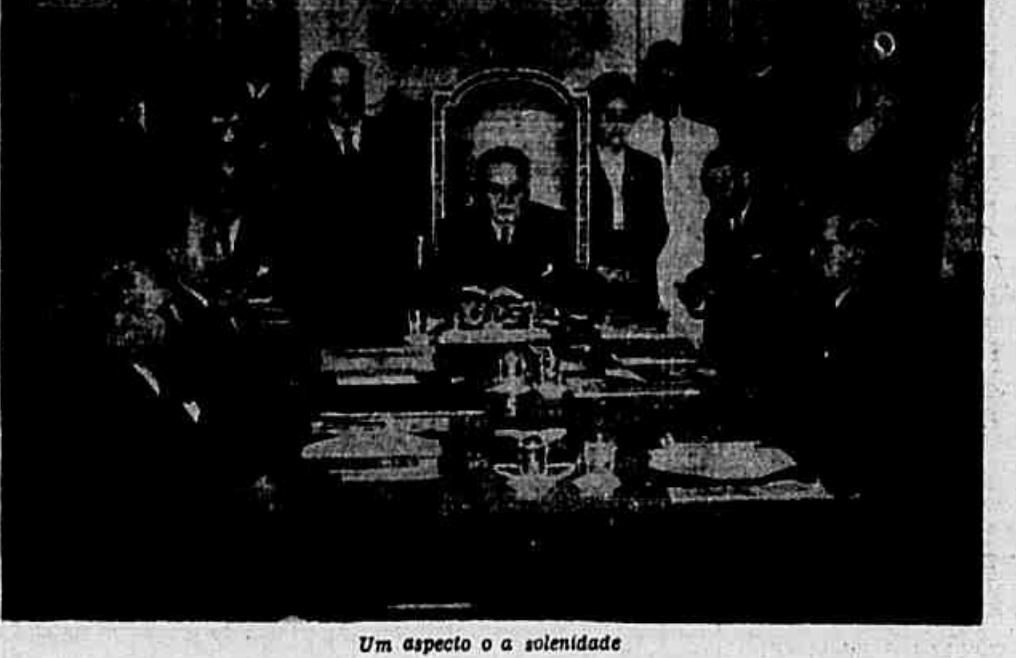
Um aspecto da solenidade

A cerimonia de ontem, no Monroe - Com o foram organizados os órgãos eleitorais