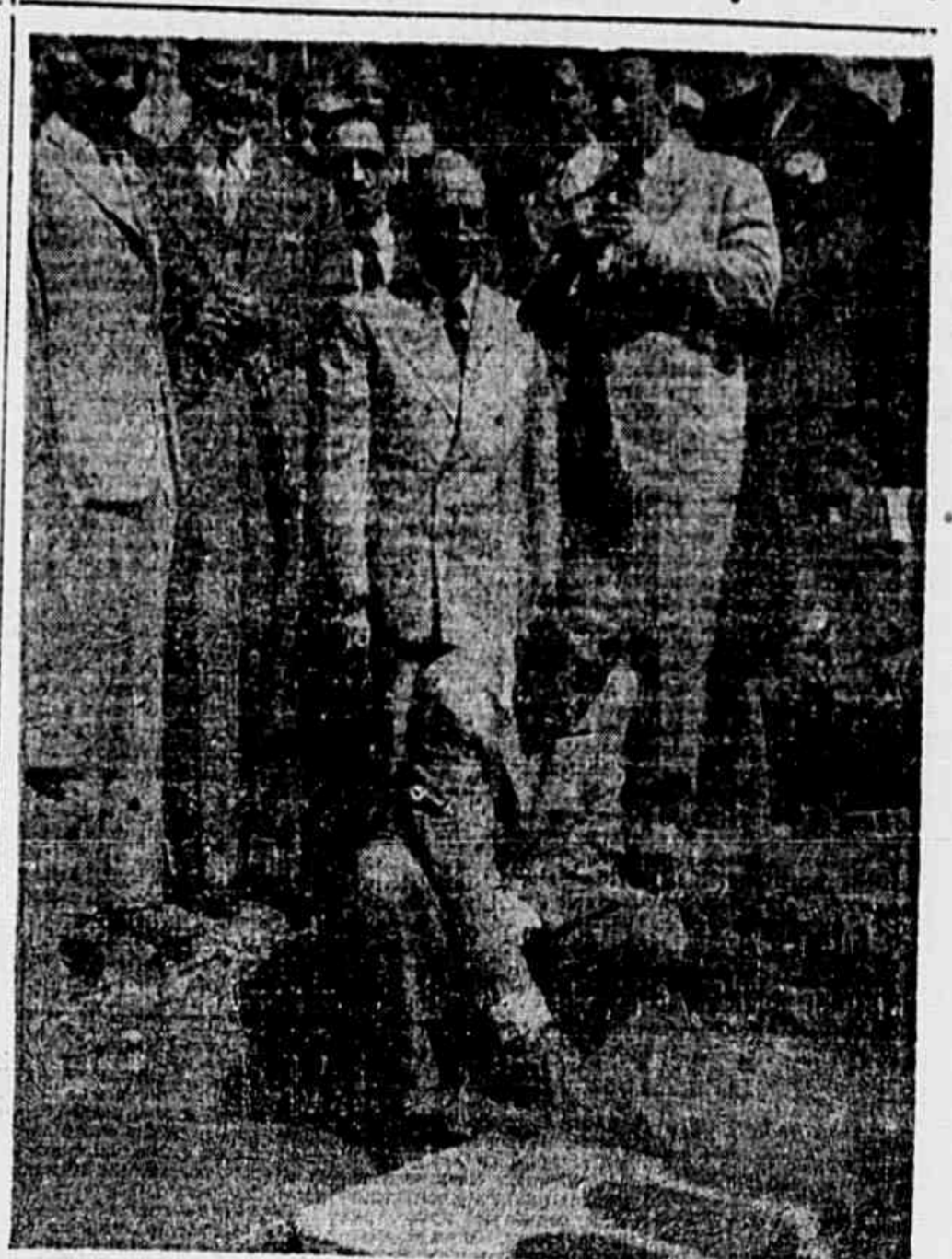
A NOVA SEDE DO FLAMENGO