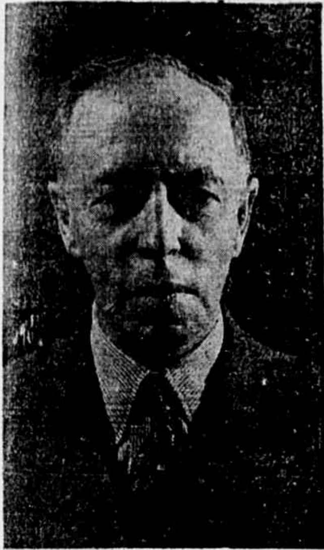
General Mendonça Lima

Dentro das mais expressivas declarações colhidas pela TRIBUNA POPULAR, a propósito do transcendente documento de Luiz Carlos Prestes, salientando-se as que nos presta o ministro da Viação, general Mendonça Lima.