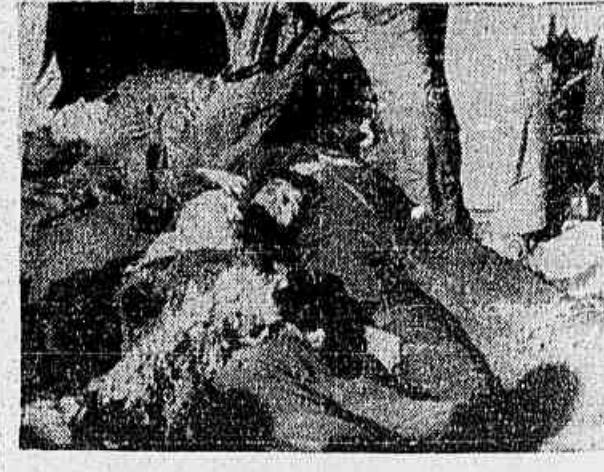
Cenas trágicas e horripilantes da morte de Mussolini e de seu amante Clara Petacci, extraída do filme em exibição desde terça-feira nas sessões PASSATEMPO - CAPITULO (Cineclândia)