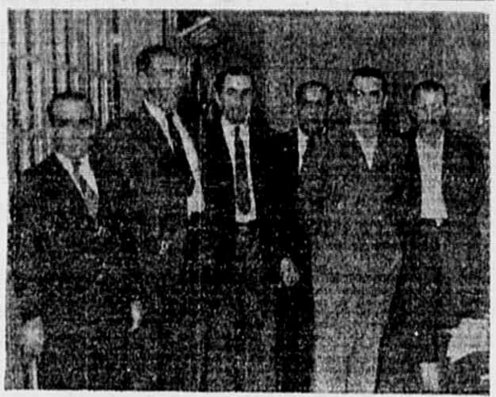
PELA INDISSOLUVEL UNIÓN DOS POVOS AMERICANOS MARITIMOS ARGENTINOS EM VISITA A "TRIBUNA POPULAR"

mentos dispensados por Franco aos republicanos espanhóis e perguntam ao caudilho: "Porque era inimigo de Laval e agora o entregamos? Muito simplesmente porque estáis com medo".