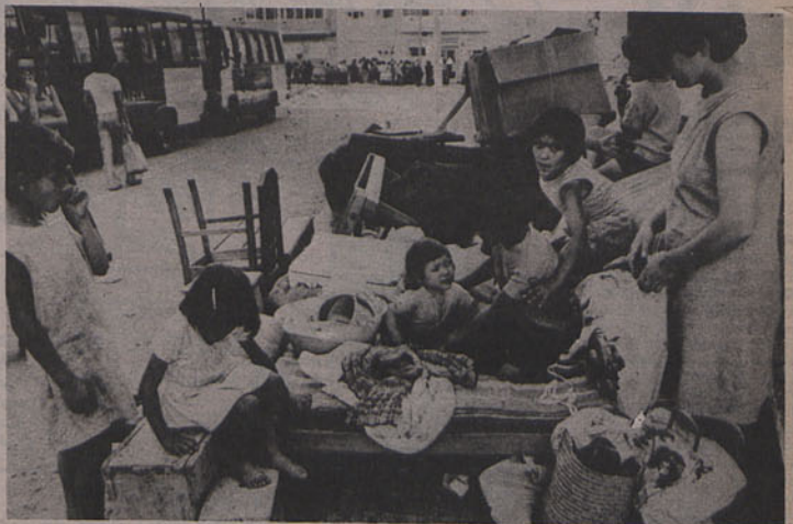
As casas voltam aos senhores que as alugam por rendas que dão bons lucros (quando não as deixam vazias à espera de melhor oportunidade...) Entretanto, quem não pode pagar, mora na rua!

Após o 25 de Novembro, e com a recuperação capitalista em marcha pela mão dos vários governos «socialistas», a questão da habitação volta