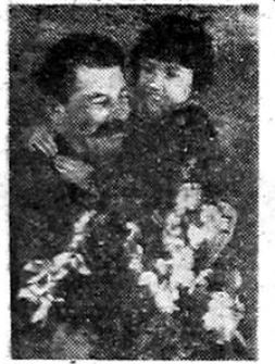
STALIN, líder amado dos povos soviéticos. Uma criança georgiana abraça-o no dia de seu aniversário.

Para este segundo dever, a natureza faz pesar sobre a mulher cargas bastante mais pesadas que as que incumbem ao homem e chega ao ponto de, muitas vezes, mais de família numerosa, pelo menos quando os filhos são pequenos, ficarem inteiramente