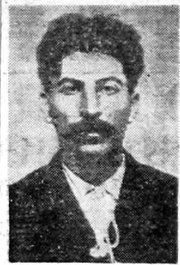
STALIN em 1911

1896-1901: — fundam-se e desenvolvem-se os círculos marxistas que agrupam e educam os operários e começam a dirigir suas lutas. Com esses operários da Transcaucásia, dos quais ele declara