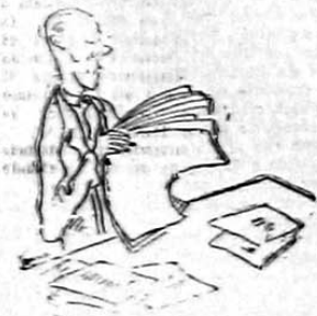
Esperado o tempo regulamentar para a leitura do seu informe, o Secretário teve a palavra concedida pela Mesa. E o pior é que ainda estava na "introdução" do "relatório"...

2) — O GOVERNO POPULAR REVOLUCIONARIO não significará a liquidação da propriedade privada sobre os meios de produção, nem tomará sob o seu controle as fábricas e empresas nacionais. O referido