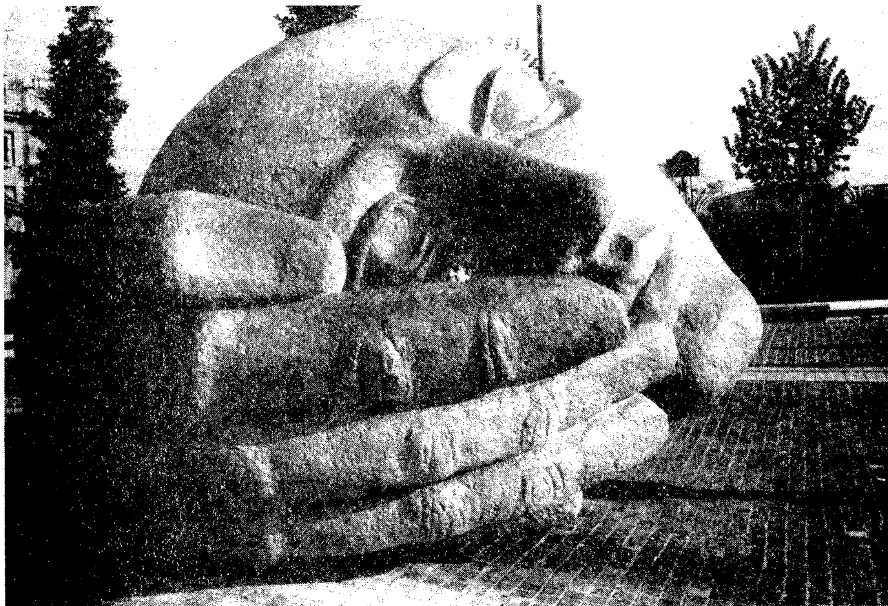
Guillotine 1988? Parijs, november 1988.