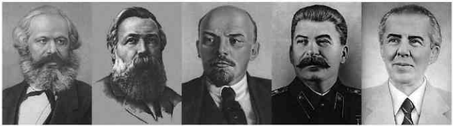
Karl Marx, Friedrich Engels, Vladimir Lenin, Joseph Stalin, Enver Hoxha