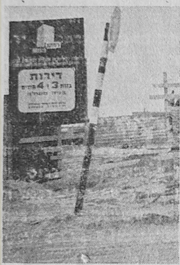
למי נועדו דירות אלו ?

בנתיבות - 98 אחוז; ובאר-יהודה 100 אחוז, דווקא מקומות דלים אלה זקוקים לשרותי חינוך רבים יותר, בגלל ריבוי התלמידים בהם.