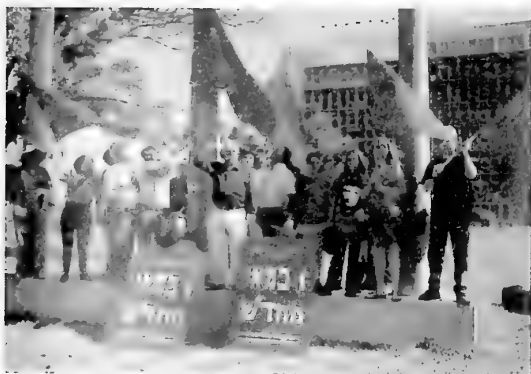
הנפת הדגל האדום באחד במאי על התורן המרכזי בבית הוועד הפועל בח'אביב

רוב העובדים בישראל, למשל, חייבים לעבוד שעות נוספות רבות ככל האפשר אם ברצונם לשלם את המשכנתא או להתגבר על האוברדרפט המעיק בבנק. כאשר אחד מכל שני עובדים משתכר עד שכר מינימום, מה פלא שהעובדים נאלצים לעבוד יותר ויותר שעות ולפעמים ביותר מאשר במקום עבודה אחד כדי להגיע לסוף החודש?