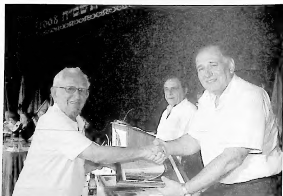
קבלת אות יקיר העיר מידי ראש עיריית חיפה, יונה יהב, 2008

יוכבד: השתדלנו שלא. זה הלך תמיד יחד. אני זוכרת את הזמנים שהם זחלו ובקושי ישבו וכבר היו יחד אתנו במועדון. הצלחנו לשלב בין גידולם לבין חיי המפלגה.