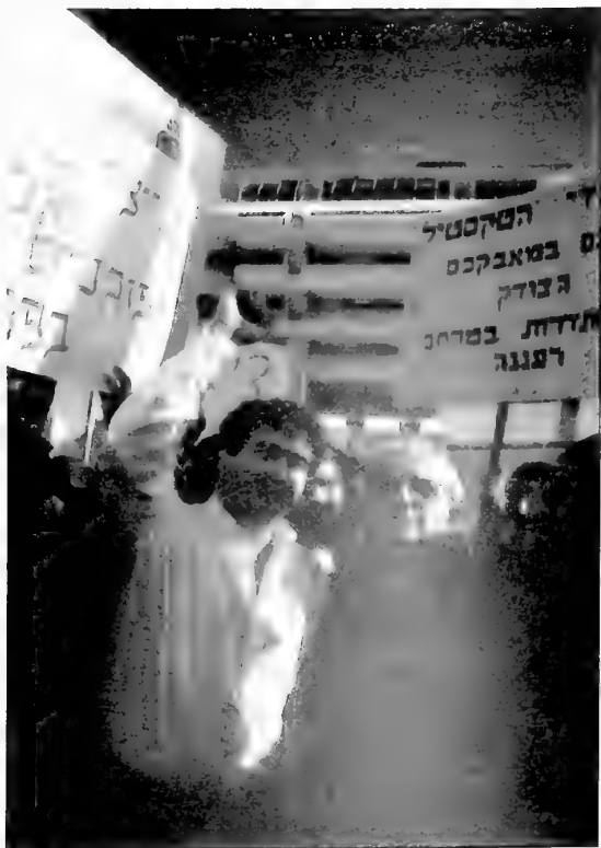
הפגנת מובטלים, מול משרד ראש הממשלה, ירושלים, 28.12.97