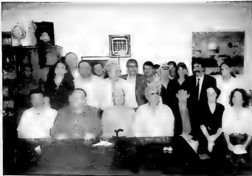
ביקור ראשי האיגודים המקצועיים הארציים בראשות היו"ר, עמיר פרץ, בלשכת יו"ר הרשות הפלסטינית, יאסר ערפאת, בעזה (אוקטובר 1996)