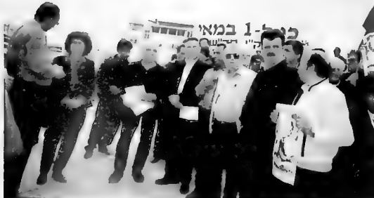
הפגנת האחד במאי בשיתוף עם עובדים פלסטינים בצומת א'ראם

שיש המוכנים להיאבק למען זכויותיהם ולהשיב מלחמה שצרה ברוח הסולידריות בין העובדים.