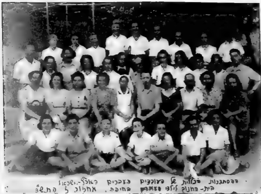
בסתבות יבולות של מוצקים בצבקים האכל-ולסכו בית-בחונג לילדי עובדים בחיפה