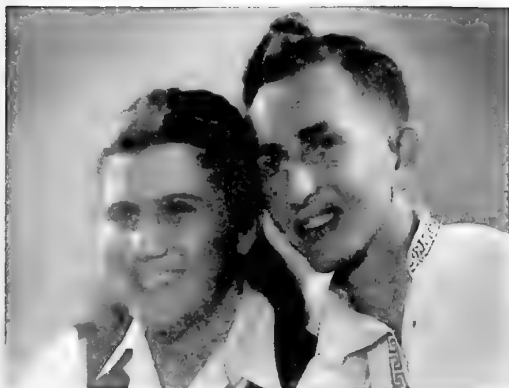
יוכנד ואני בסיום לימודיה בתיכון

וקראנו גם הרבה ספרות יפה, שורה ארוכה של ספרים כמו "כיצד נתחשלה הפלדה" (הוצאת הקיבוץ המאוחד, 1947, תרגום: ח.ש. בן-אברם) ו"אנשי פאנפילוב" (הוצאת הקיבוץ המאוחד, 1946, תרגום: שלמה אבן-שושן). אהבתי במיוחד את "האוניברסיטאות שלי" מאת מקסים גורקי ("כתבים", הוצאת ספריית פועלים, 1954, תרגום: לאה גולדברג).