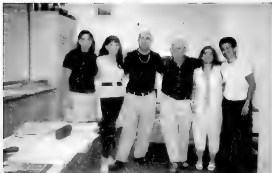
צוות חדר המצב עם סיום עבודתי