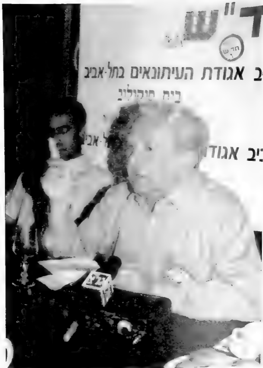
במסיבת עיתונאים ערב הבחירות, 1998