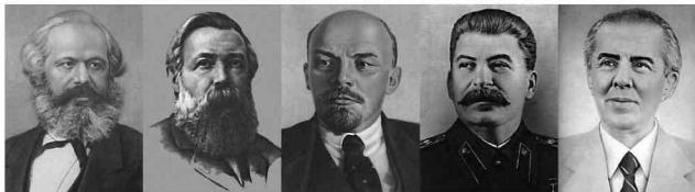
Karl Marx, Friedrich Engels, Vladimir Lenin, Joseph Stalin, Enver Hoxha 5 Classics of Marxism

Comintern (Stalinist-Hoxhaists) http://ciml.250x.com