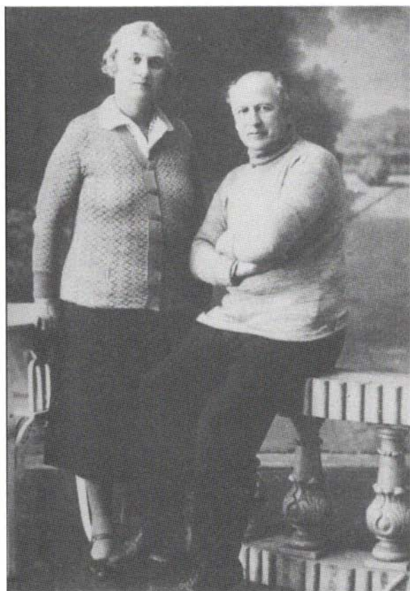
Christian Rakovski à Barnaoul (Sibérie) en haut, en 1929 à gauche, en 1932