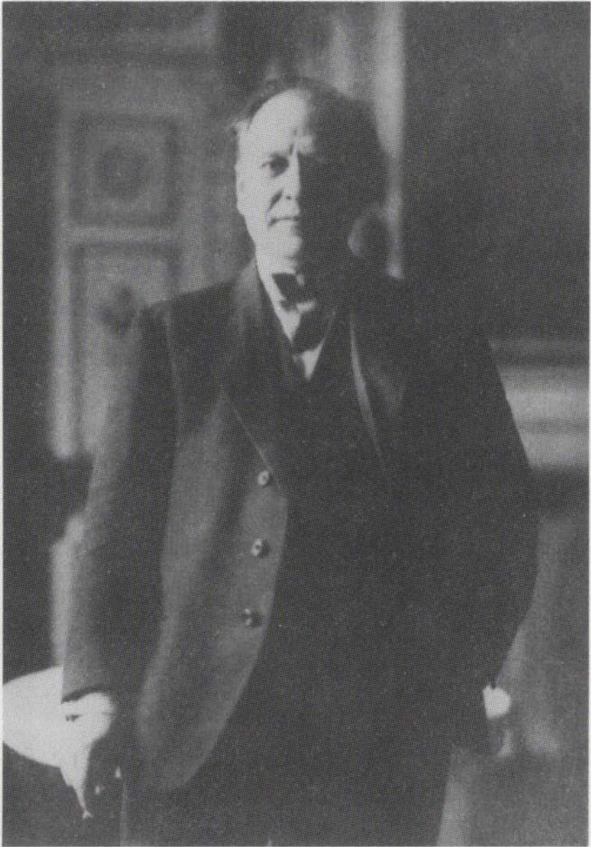
Christian Rakovski, 1925-26