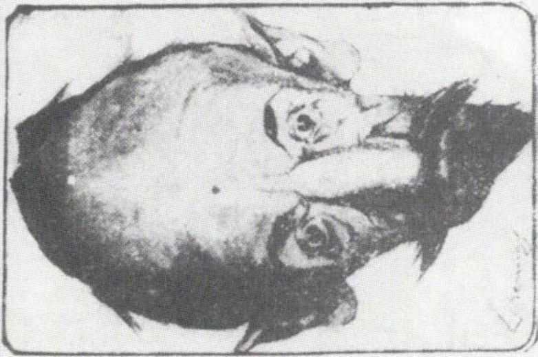
Les deux complices: Tchitchérine (à gauche) et Rakovski