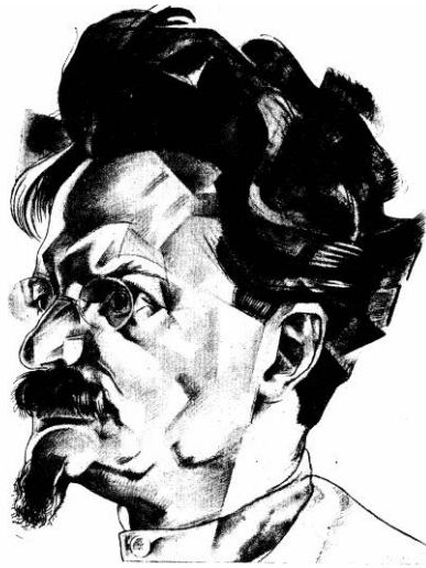
TROTSKY