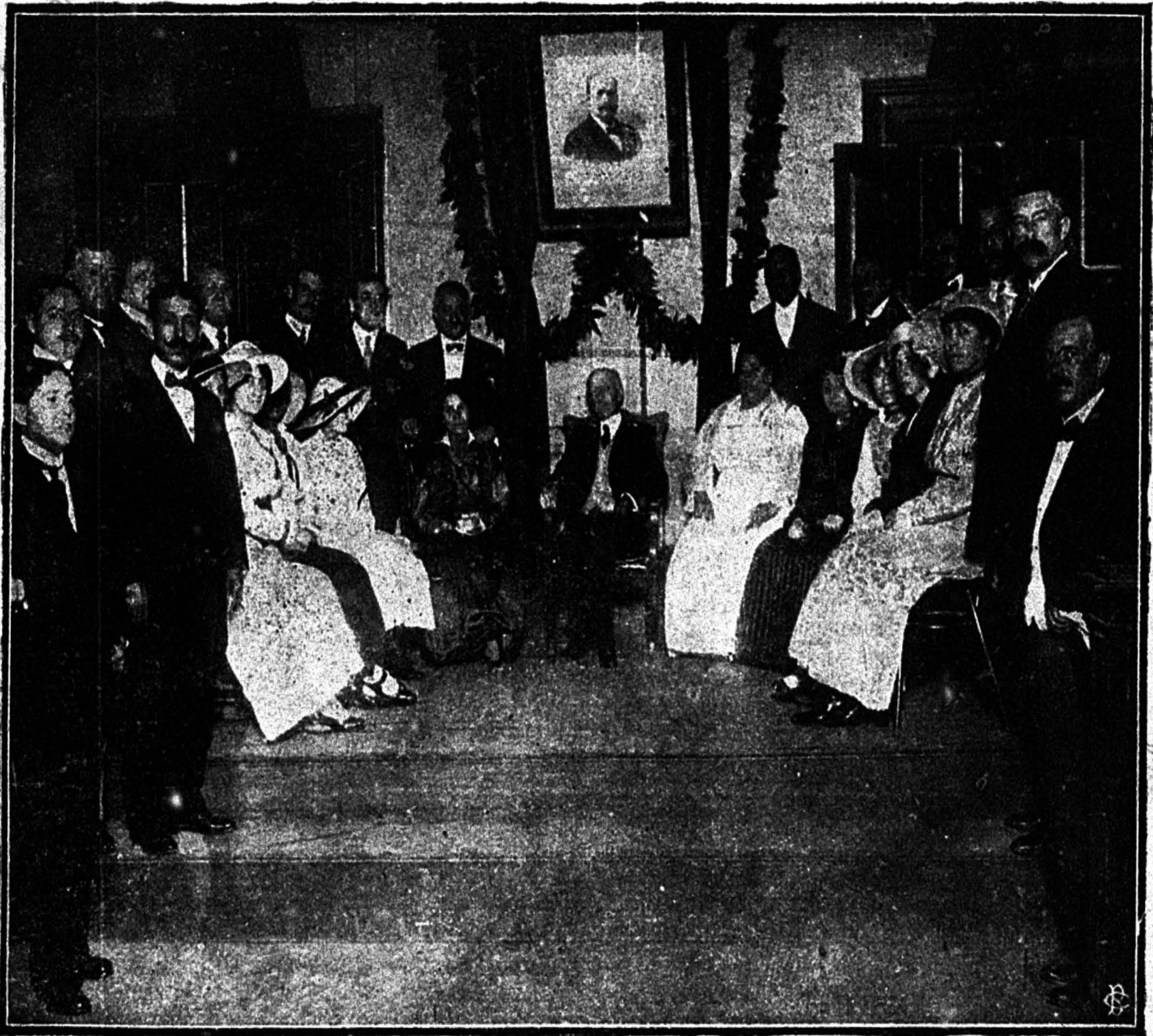
S. E. el Presidente del Consejo de Ministros y Ministro de RR. EE. Dr. Enrique de la Riva-Agüero, rodeado por las señoras y señoritas concurrentes a la soiree obrera, y por el Directorio del "Centro Internacional Obrero de Solidaridad Latino Americana. organizador de las fiestas del 1.º de Mayo.