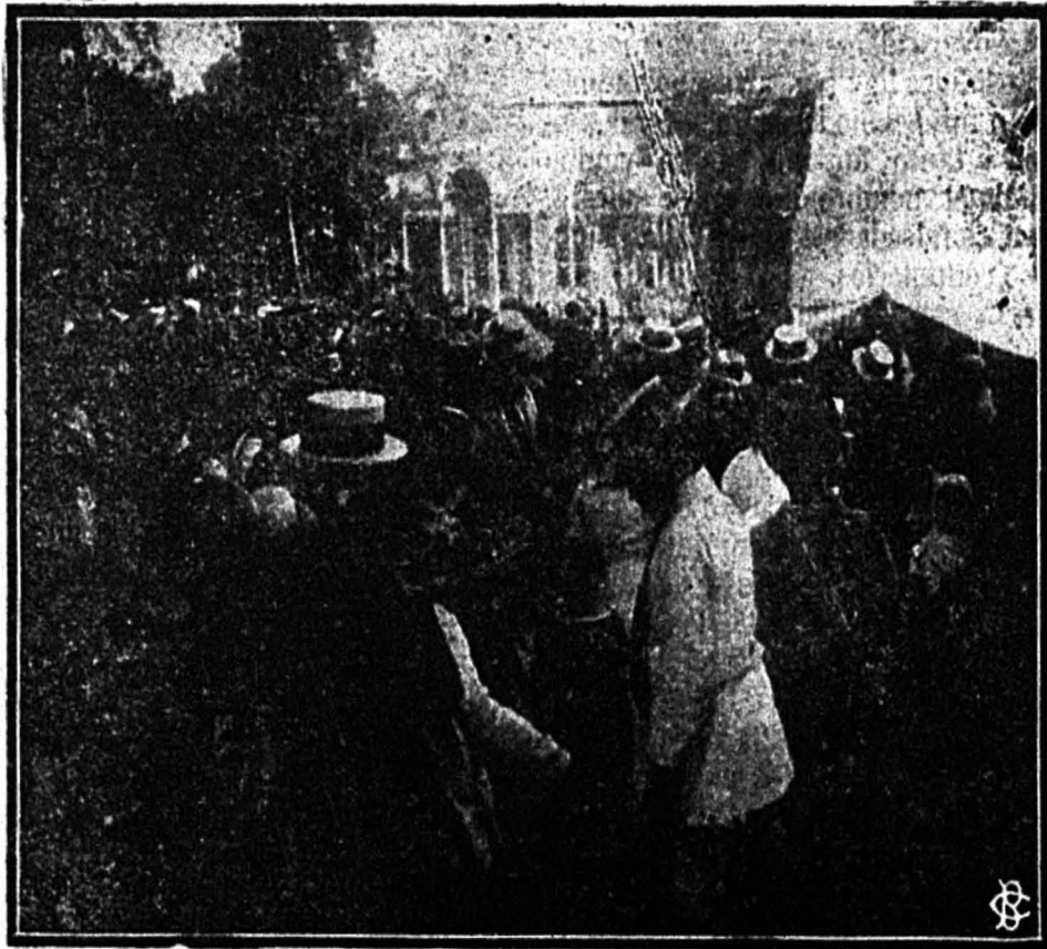
En el Kiosko en que se repartía cerveza de Backus & Johnston y refrescos

vencibles, impidiendo a los trabajadores ser fuertes y unidos. Rotos algunos eslabones de sus cadenas, quedaban en la condición de los libertos de la Edad antigua.