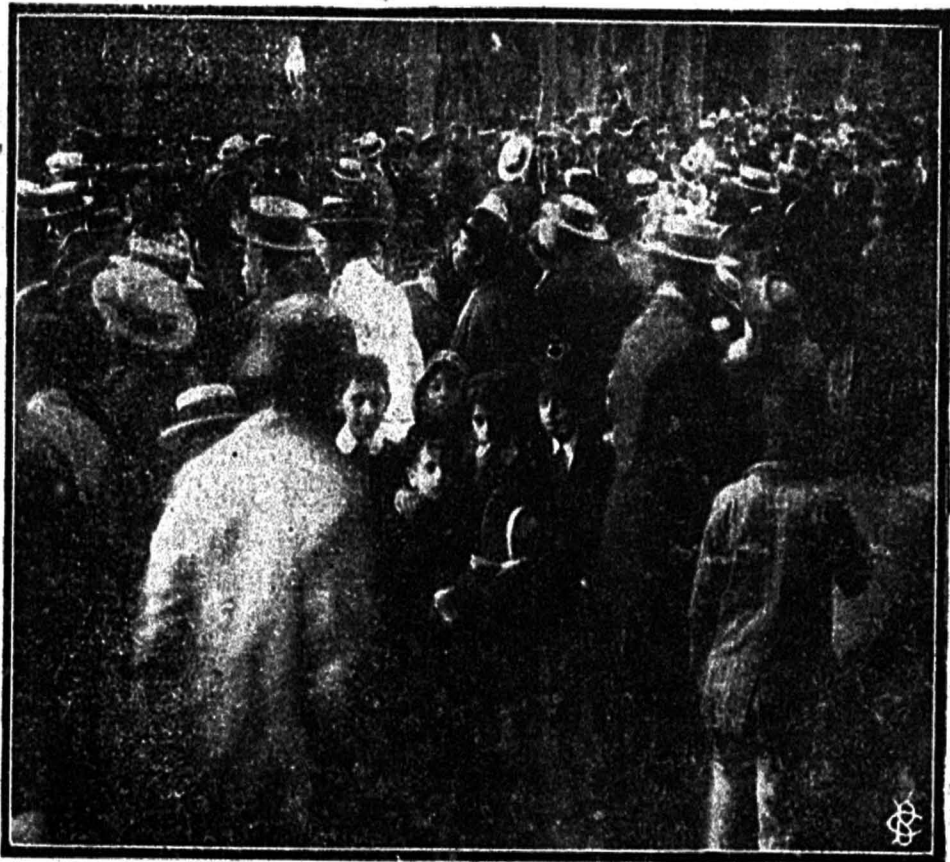
Frente al Kiosko en que se repartía juguetes, galletas y dulces a los niños concurrentes

A las 8 p. m. acompañado por una selecta comisión de obreros, ingresó en el salón el Excmo. Sr. Doctor Don Enrique de la Riva-Agüero, Presidente del Consejo de Ministros y Ministro de Rela-