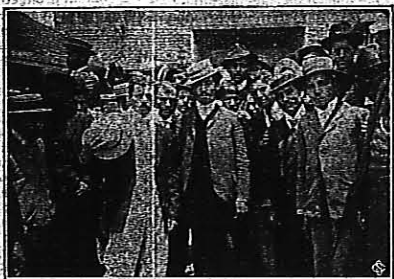
La huelga de Motoristas y Conductores en unión de varios compañeros libertarios