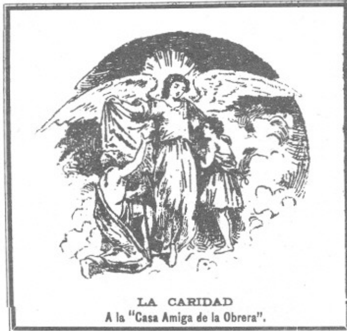
LA CARIDAD A la “Casa Amiga de la Obrera”.

Quando llega la hora del descanso va al hogar fatigada por el trabajo, y con la algarabía propia del niño, le cuenta sus adelantos; quiere leer y escribir, hacer cuentas, pues ya conoce los números, y refiere cómo jugó ese día. Su madre lo estrecha en sus brazos, sus labios murmuran una oración y de sus ojos húmedos se desprende una lágrima