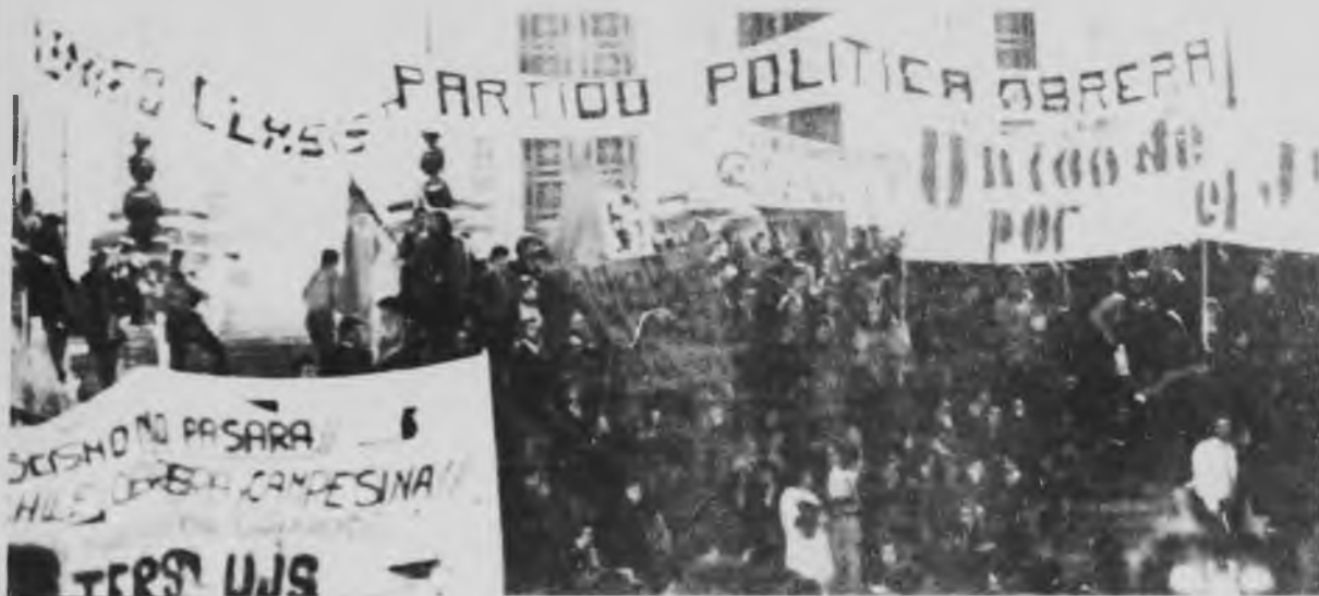
El gobierno prepara un complot para ilegalizar al trotskismo

quel momento: los partidos comunistas "han dejado de ser peligrosos": "los EEUU y la URSS (léase burocracia rusa) se entienden". Refiriendo al stalinismo argentino lo llamó a colaborar, a "no sacar los pies del plato".