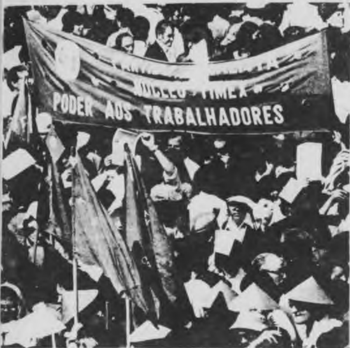
Acto socialista: el poder a los trabajadores

El Partido Socialista comenzó a ser el receptáculo de la radicalización obrera y de la lucha contra la regimentación que impulsaba el stalinismo y el MFA. Esto explica que muchos obreros comunistas votaran por el PS y que en las últimas elecciones sindicales (como el Sindicato de Bancos) de manos del PC pasara al PS. En síntesis, el PS comenzó a aglutinar a todas las corrientes obreras partidarias de defender las comisiones obreras y contra las leyes antisindicales (antihuelgas y de asociaciones profesionales), a pesar del rol colaboracionista de su dirección.