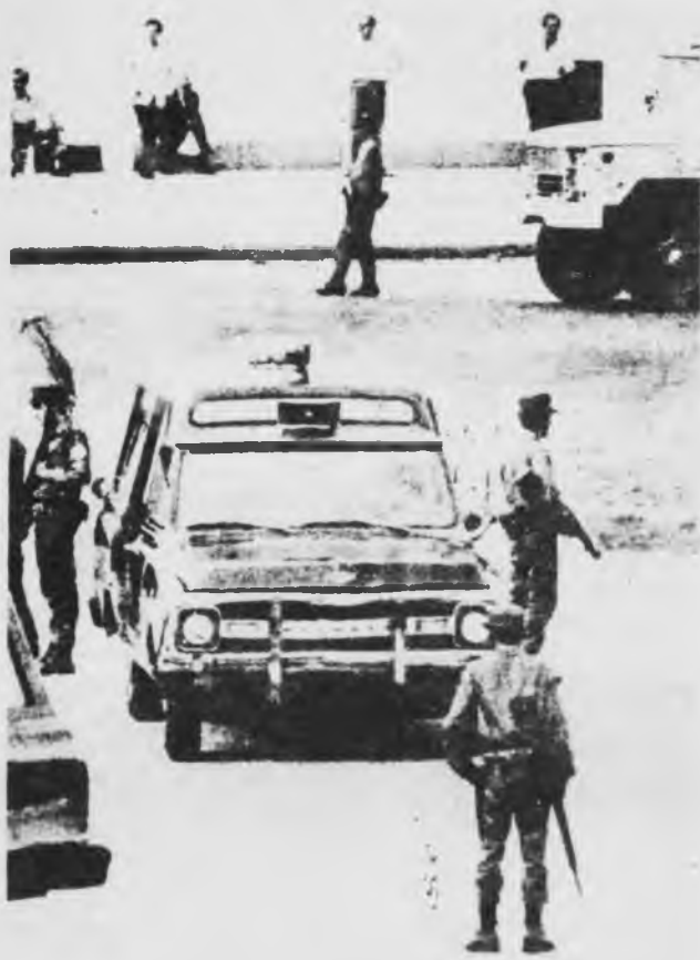
El actual régimen político de Uruguay surge de la derrota de la huelga general revolucionaria de fines de junio de 1973, traicionada por el partido comunista y la CNT

bienes de importación hacen subir los valores unitarios de ésta en un 65 por ciento. En 1974, el déficit del balance de pagos es de 142 millones de dólares en un total de 370 millones de dólares de exportación total.