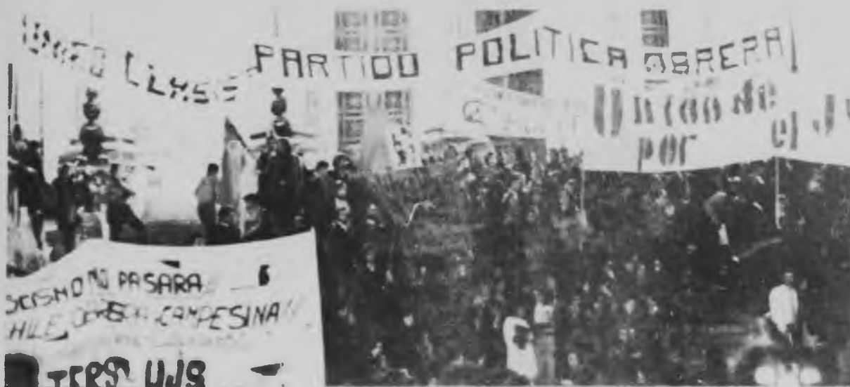
El gobierno prepara un complot para ilegalizar al trotskismo

quel momento: los partidos comunistas "han dejado de ser peligrosos"; "los EEUU y la URSS (léase burocracia rusa) se entienden". Refiriendo al stalinismo argentino lo llamó a colaborar, a "no sacar los pies del plato".