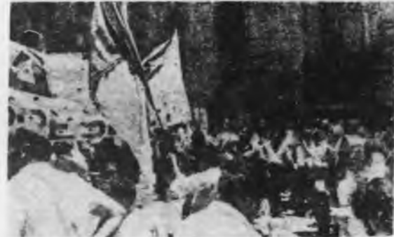
Los operarios de IME piden su definición a la CGT

Hoy, la Comisión de Solidaridad debe abocarse a organizar un gran acto público para terminar con el lock out patronal y reincorporar a todos los trabajadores cesanteados.