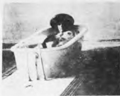
HOSPITAL PSIQUIATRICO KOCHENKO, EN MOSCÚ

* La sugestión de crear un cuerpo de "médicos monitores" en las empresas, es una síntesis de los psicólogos norteamericanos y los "psiquiatras clínicos" de la KGB (que aplican métodos como los de la foto, contra los intelectuales disidentes).