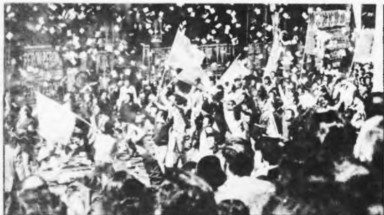
*Para comprender el fracaso del "desfile" debemos relacionarlo con el carácter del paro: la medida de fuerza no significó ni directa ni indirectamente una movilización por objetivos sociales y políticos de la clase.

La Juventud Peronista afirma que si hubiera cambiado el intermediario entre Perón y las masas, si ese intermediario hubiera sido ella misma, el "desfile" hubiera sido completamente distinto. La naturaleza del intermediario, sin embargo, tiene que ver con el carácter y la función de la intermediación. La burocracia ha firmado el "pacto social" en su carácter de intermediaria entre Perón y los trabajadores peronistas (a cuenta de la burguesía) -esa es su función. Si la Juventud quiere llenar ese espacio tiene que asimilarse por entero a los planteos de la burguesía y no hacerlo a medias como hasta ahora. Pero en ese caso hubiera sido, su hipotético "desfile", del mismo carácter que el del 31.