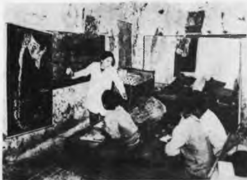
* Escuela provincial.

Deberemos probar si en materia educacional, el programa, las propuestas y lo ya hecho en la materia confirman esta aseveración. Comprenderemos así el cuadro y el propósito de los distintos proyectos de ley universitaria, elaborados por el peronismo, para el reordenamiento de la enseñanza superior.