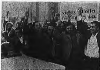
OBRENOS MECANICOS FESTEAN LA VICTORIA BARRION