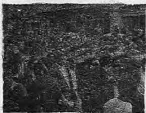
Varios ejes de objetos recuperados hasta el momento los restos de un compañero Lanusea, muerto como consecuencia de la tortura.

En la semana pasada 800 policías reprimitieron el intento de protesta organizado por la comisión que exige reformas a la provisión de gas para la población de Morón.