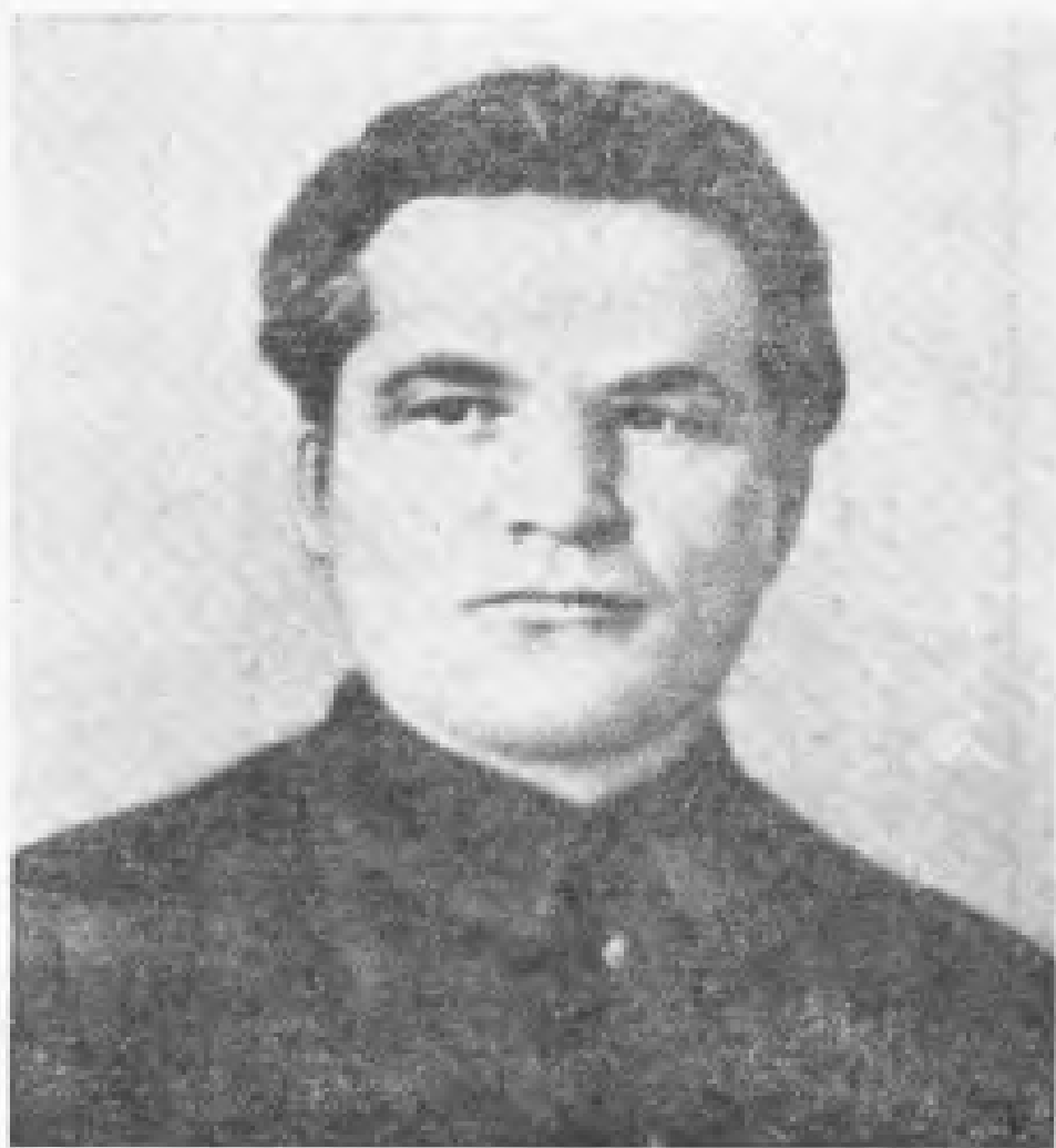
基 塔 夫