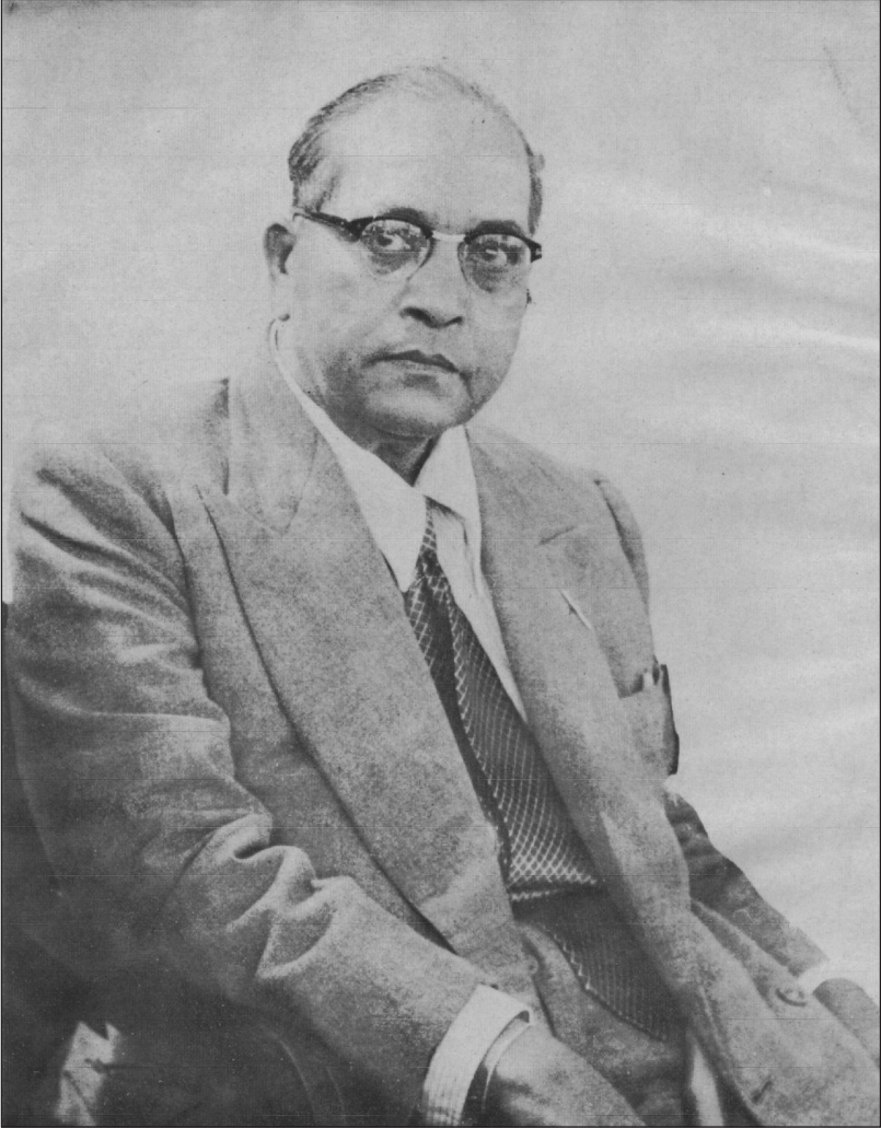
Babasaheb Dr. B.R. Ambedkar (14th April 1891 - 6th December 1956)